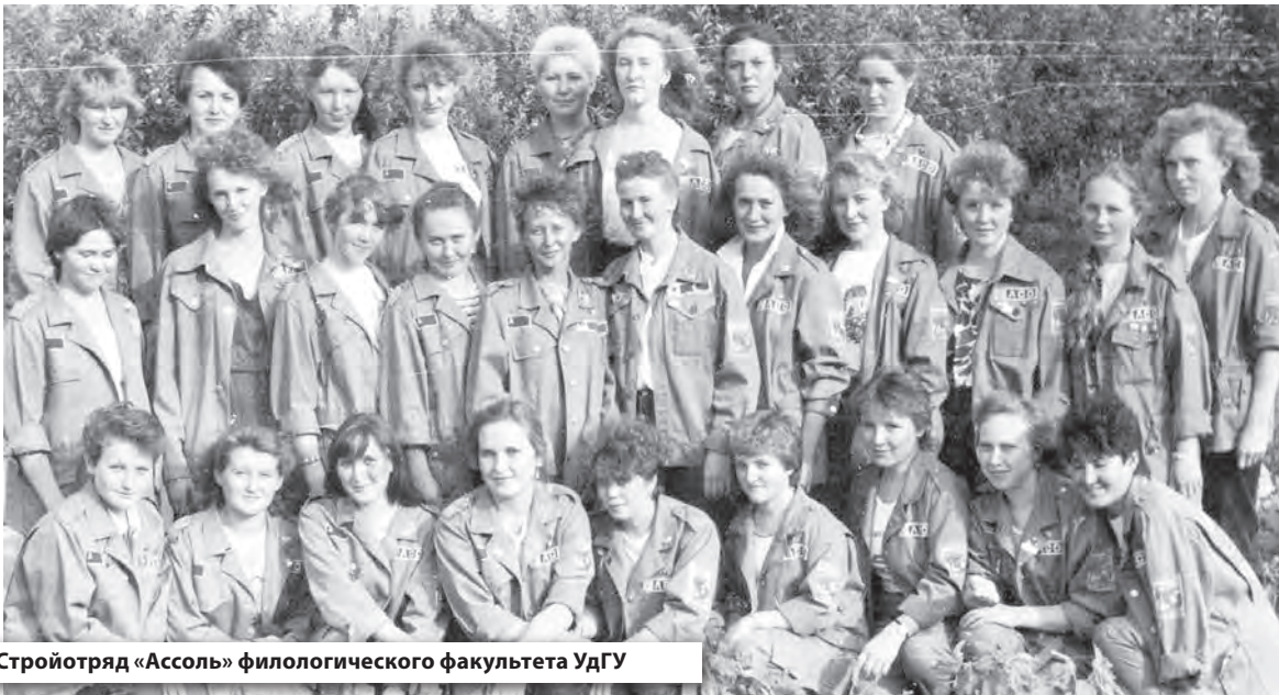
Стройотряд «Ассоль» филологического факультета УдГУ