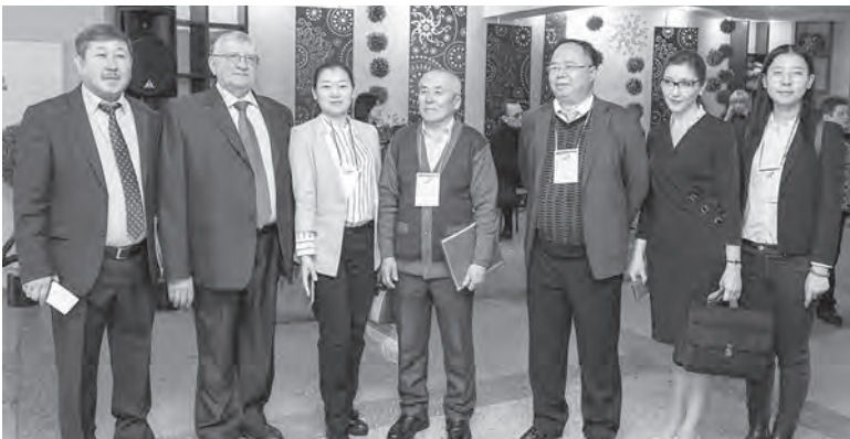
Делегация из Китая на открытии ярмарки

Программа ярмарки очень насыщенная, хочется многое увидеть, на данный момент меня заинтересовала разработка коллег из г. Братска о самообразовании педа-