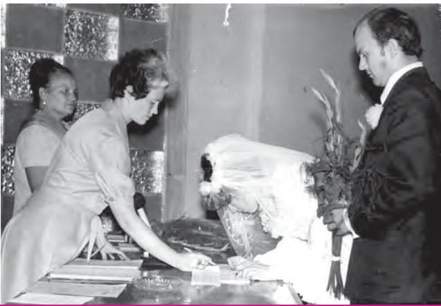
Регистрация бракосочетания, 1975 год

100 лет (1918 год) со дня образования отдела записи актов гражданского состояния (ЗАГС) при Сарапупульском отделе городского хозяйства.