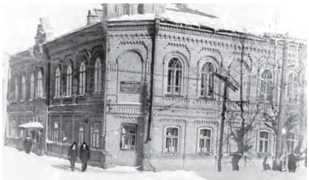
Здание городского народного суда, 1959 год

100 лет (1918 год) со дня образования народного суда г. Сарапупула и Сарапупульского уезда.