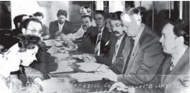
Совещание руководителей медицинских учреждений города в отделе здравоохранения исполкома Сарапупульского горсовета, 1983 год

80 лет (1938 год) со дня организации отдела здравоохранения исполкома Сарапупульского горсовета (ныне – Управление здравоохранения города Сарапупула).