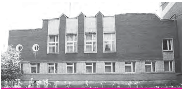
Здание Молодежного центра, 2015 год

20 лет (1998 год) со дня создания муниципального учреждения социального обслуживания «Городской центр социально-психологической помощи и реабилитации несовершеннолетних, молодежи и молодых семей» (ныне – Муниципальное бюджетное учреждение «Молодежный центр»).