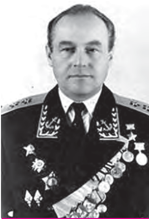
В. Г. Стариков – Герой Советского Союза

После войны служил в ВМФ, был начальником Тихоокеанского высшего военного морского училища.