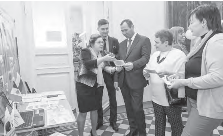
Педагоги школы № 21 знакомят со своим проектом представителей Совета Федерации

Сегодня в Сарапуле проходит XVI Международная ярмарка социально-педагогических инноваций