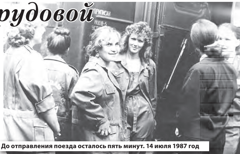
До отправления поезда осталось пять минут. 14 июля 1987 год

Время в пути пролетело незаметно. На поезде «Ижевск-Москва»