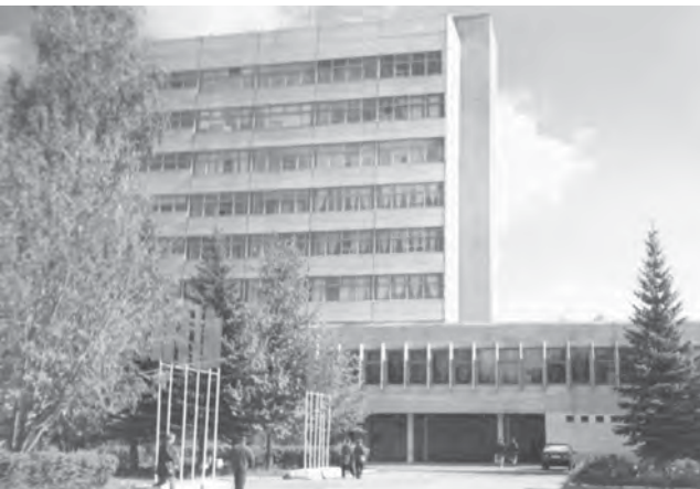
Административно-лабораторный корпус завода «Электонд»

45 лет (1973 год) назад состоялась торжественная закладка первых высотных зданий города – административно-лабораторного корпуса завода «Электонд» и 54-квартирного девятиэтажного жилого дома.