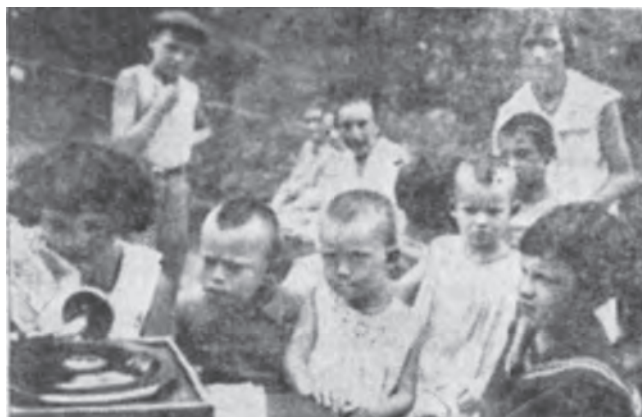
Детский праздник на площадке уличного комитета ул. М. Горького. Дети слушают патефон

Уличным комитетам других улиц следует подхватить инициативу горьковцев.