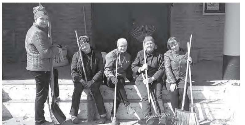
Коллектив Шевыряловского СКЦ на уборке территории

Субботники проходят во всех поселениях и продлятся до 15 мая. Убрать мусор и привести территорию в порядок выходят сотрудники организаций и предприятий, жители сел и деревень.