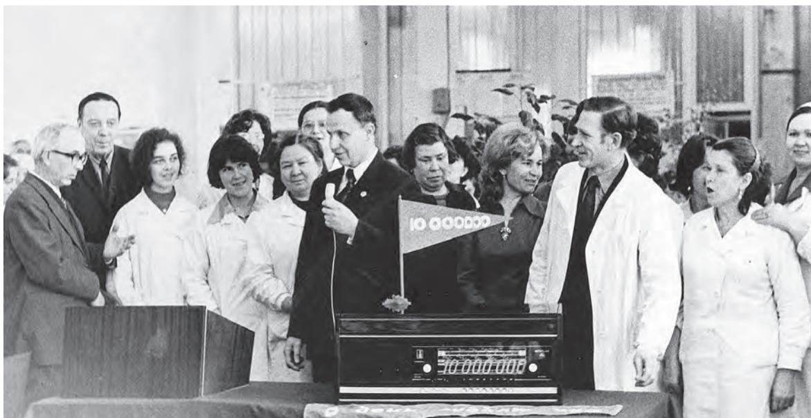
10-миллионная радиола. Модель «УРАЛ-112», 1978 год