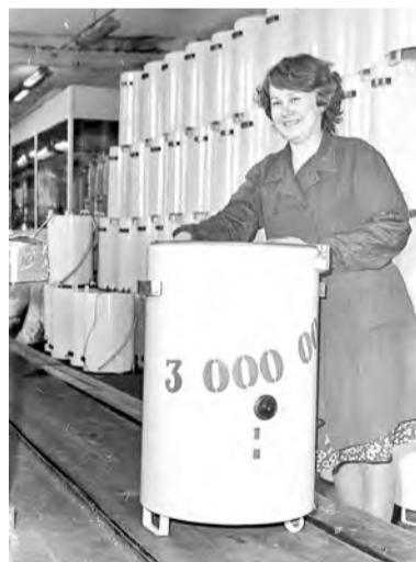
завод новой техникой.

29 июня 1963 года инструментально-механический завод и завод «Красный металлист» были вновь объединены в завод под названием «Завод электробытового оборудования», который был переведен в систему Западно-Уральского совнархоза. С этого времени начинается новая эпоха в развитии завода – он специализируется на выпуске стиральных машин. Производство их бурно растет. Совнархоз оснащает