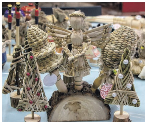
■ Милые сувениры из розога мастера Светланы Князевой украсят любой интерьер и станут прекрасным подарком к Новому году