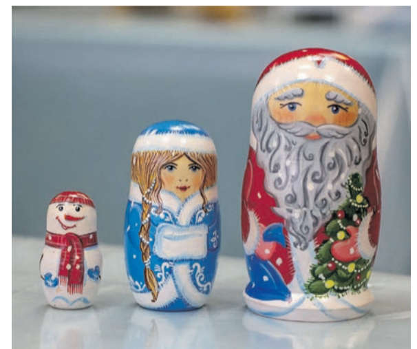
■ Деревянные игрушки и матрешки «оживают» под руками мастера по росписи Натальи Кудакowej