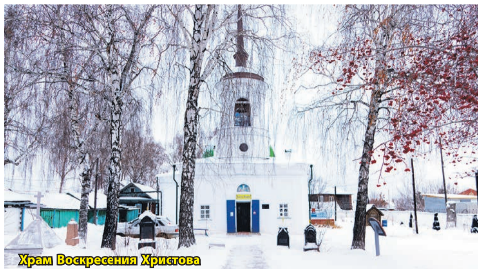
Храм Воскресения Христова

Император также стал мучить старца, требуя отречься от веры. Но Сила Божия помогла святому. Кроме того, по его молитве стали совершаться чудеса: воскрес умерший юноша, исцелился бесноватый, мучимый бесом 35 лет, так что народ во множестве стал исповедовать Христа Спасителя. Во Христа уверовала даже дочь императора Галина, дважды сокрушившая идолов в языческом храме. Полные злобы Септимий Север и его вельможа Крисп воздвигли хулу на Господа, глумливо призывая Его сойти на землю, похваляясь своей силой и властью. Во гневе Господь поколебал землю, великий страх напал на всех, оба же нечестивца повисли в воздухе, связанные невидимыми узами, и лишь по молитве святителя были возвращены вниз. Устрашенный император поколебался было