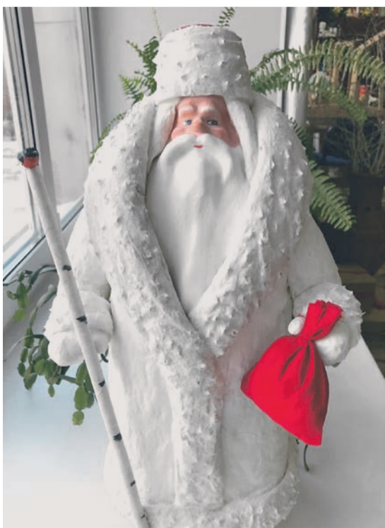
■ Дед Мороз, изготовленный в 1970 году, после реставрации