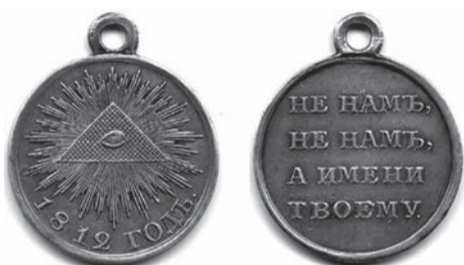
5 февраля 1813 года в память Отечественной войны была учреждена серебряная медаль императором Александром I

На портрете можно рассмотреть медаль «В память 1812 года», которой он был награжден