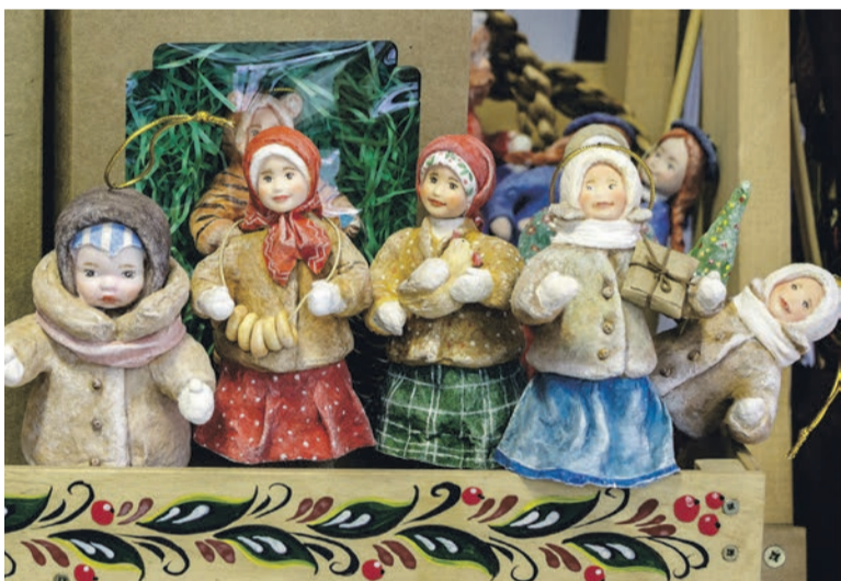
■ Сувенир, игрушка на елку, подарок к Новому году – ватные игрушки пользуются большим спросом