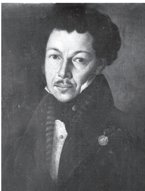
Филимонов Игнатий. Портрет майора Федора Михайловича Гутковского. 1826 г.

Начиная с 9 июня 1812 года, после вторжения французских войск в российские пределы, Федор Гутковский принимает участия в сражениях: «14 июля при Витебеле, а 4 и 5 августа - при городе Смоленске, где Гутковский получил