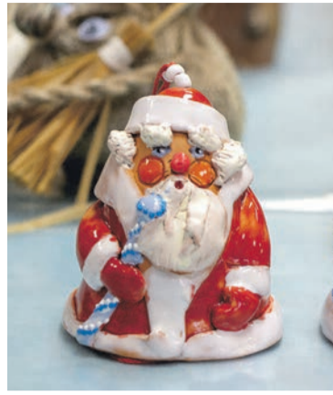
■ Колокольчики из керамики мастера Елены Гончаренко