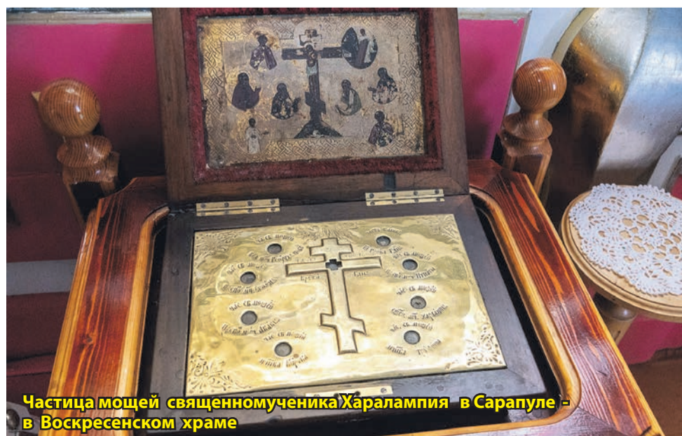
Частичка мощей священномученика Харалампия в Сарапуле - в Воскресенском храме

Сегодня мощи священномученика Харалампия находятся в одном из шести сохранившихся Метеорских монастырей в Греции - монастыре святого Стефана, а частицы - во всем православном мире, в том числе и в городе Сарапуле. И действительно, есть свидетельства, что там, где находится даже частичка мощей святого, не бывает эпидемий.