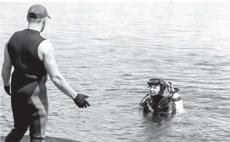
Спасатели исследуют дно места отдыха

На правом берегу р. Камы в центральной части города организуется место отдыха горожан