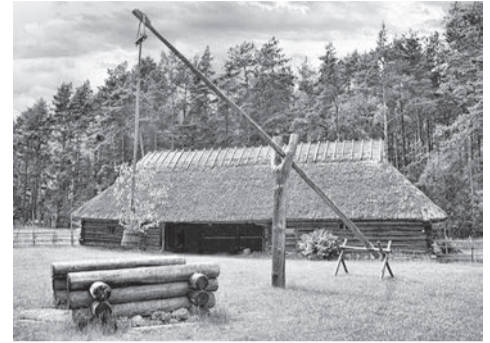
Музей под открытым небом в Эстонии «Хутор Сасси-Яани»