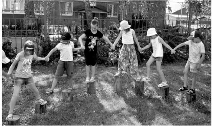
Занятия в сенсорном саду

Именно так в июне проходили занятия по программе «Познавая природу – познаешь себя» и интерактивные экскурсии по летнему сенсорному саду в рамках проекта «Сад на ладошке», реализуемых в Центре «Потенциал» за счет средств Фонда президентских грантов