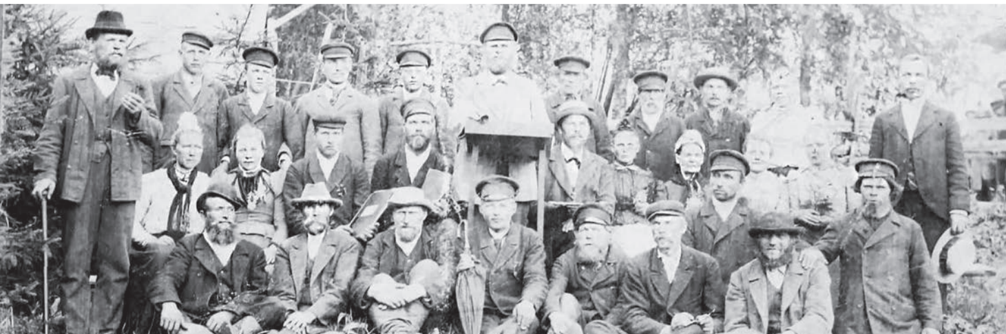
Эстонское полеводческое общество в Тверской губернии, 1903 год