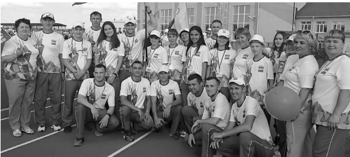
Команда Сарапульского района

С 30 июня по 3 июля в с. Грахово прошли XXX Республиканские летние сельские спортивные игры