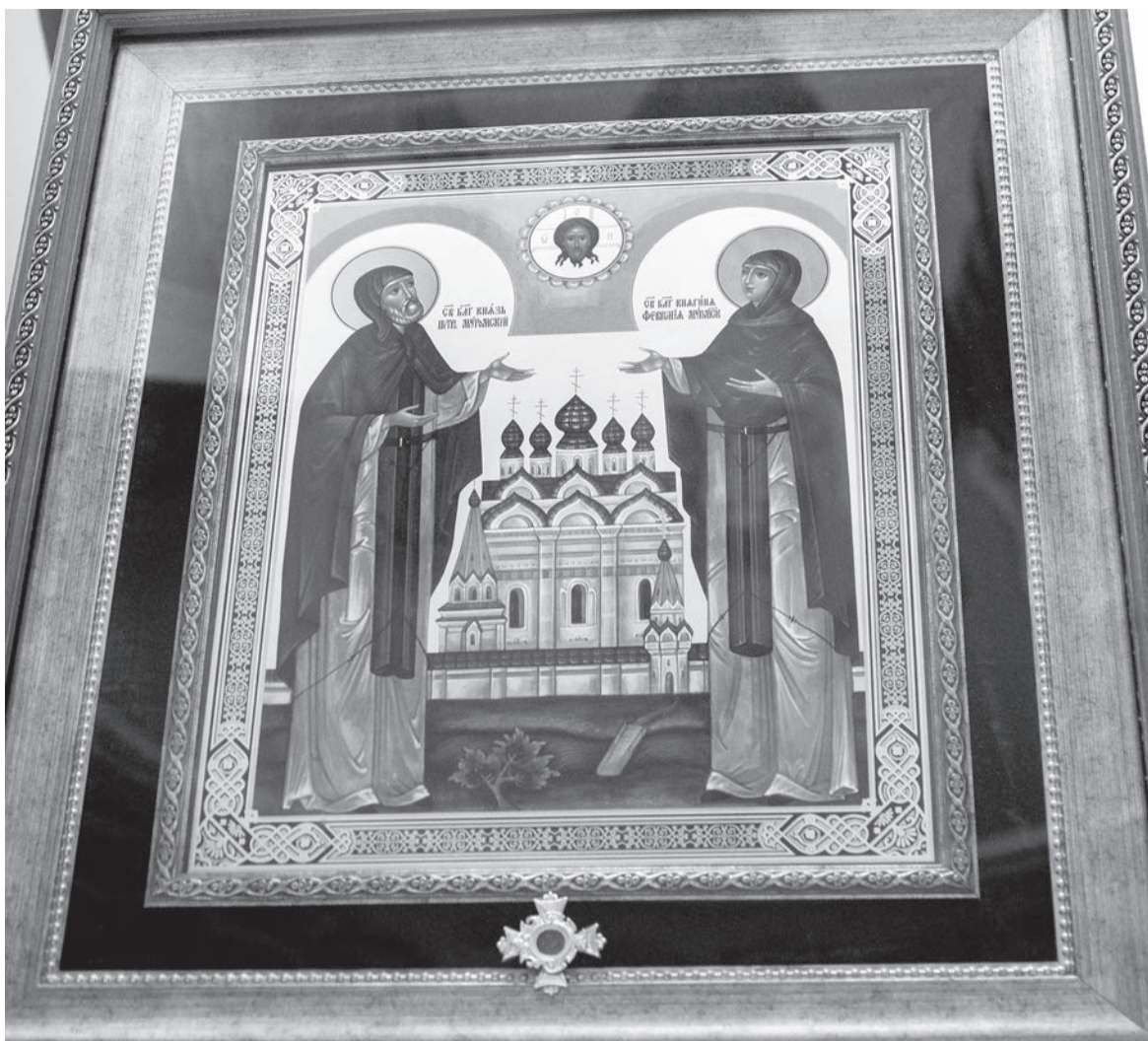
В Сарапуле, в Покровском кафедральном соборе, находится икона с частицей мощей святых Петра и Февронии

Праздник этот на Руси появился благодаря муромскому князю Петру и его жене Февронии, которые жили в XIII веке