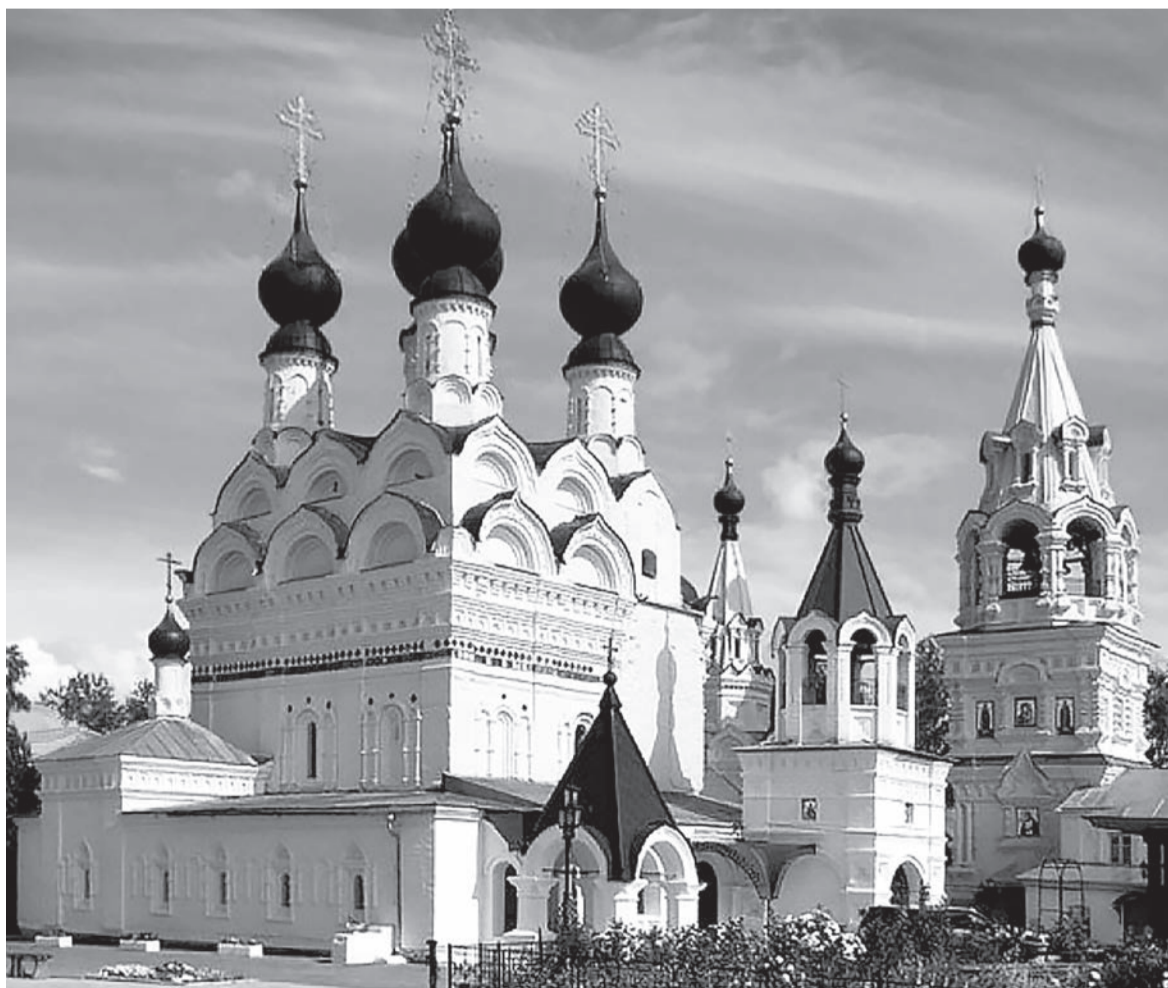
Свято-Троицкий женский монастырь в г. Муроме. Здесь пребывает рака с мощами святых Петра и Февронии