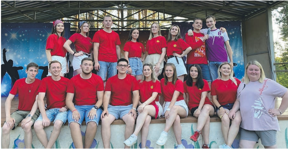
■ Вожатский состав второй смены

5 июня в детском оздоровительном лагере «Орленок» был дан старт новому летнему сезону «Стать космонавтом», приуроченному к Году науки и технологий в России и 60-летию первого полета человека в космос