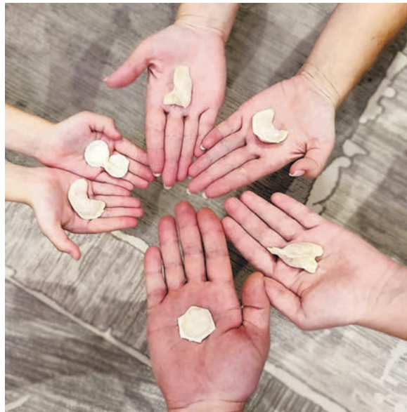
Пельмешки, приготовленные на семейный ужин, январь 2023 года

В воспоминаниях моего детства лепка пельменей - это особый семейный ритуал выходного дня, когда все собирались в тесной кухне, у каждого были свои обязанности, а меня ждала маленькая скалка и длительный усердный труд. Начинка семейных пельменей была традиционной - отборное мясо (говядина и свинина), соль и перец. Мясо нужно было обязательно повернуть на мясорубке с мелкой решеткой, а потом долго рубить в корыте с небольшим количеством воды (этим занимался дед).