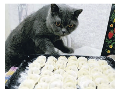
Кошка Зара и пельмени