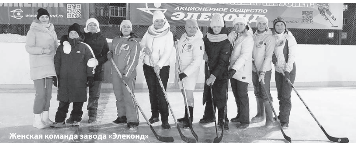
Женская команда завода «Элеконд»