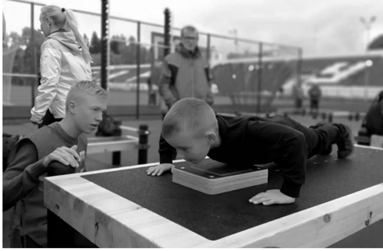
Сарапульцы сдают нормы ГТО