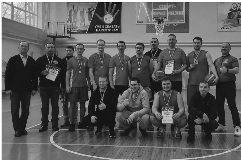
Команда Управления образования