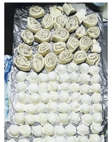
Вот сколько мы настряпали