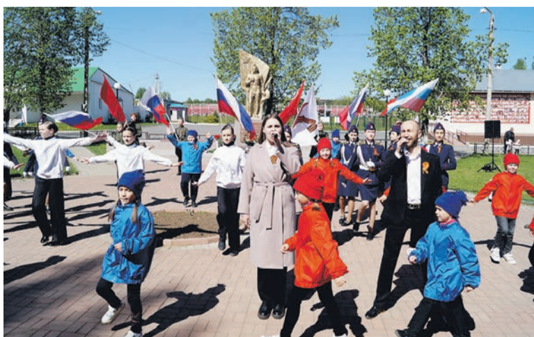
День Победы в с. Сигаево