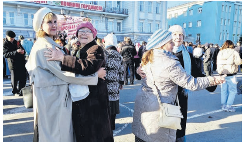
Сарапульцы танцуют вальс