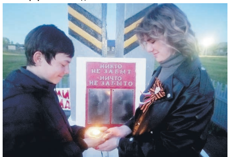
Акция «Свеча памяти» в с. Октябрьский