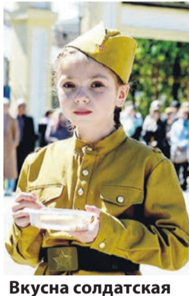
Вкусна солдатская каша