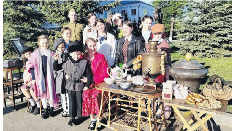
Выставка экспонатов времен Великой Отечественной во-