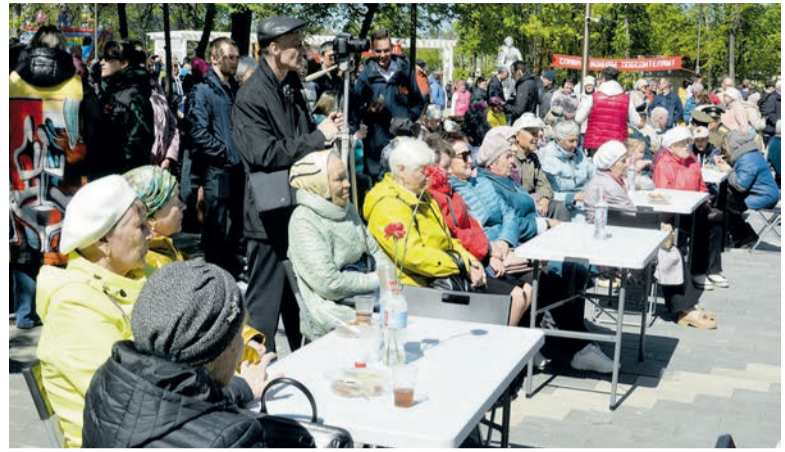
В городском саду им. А.С. Пушкина