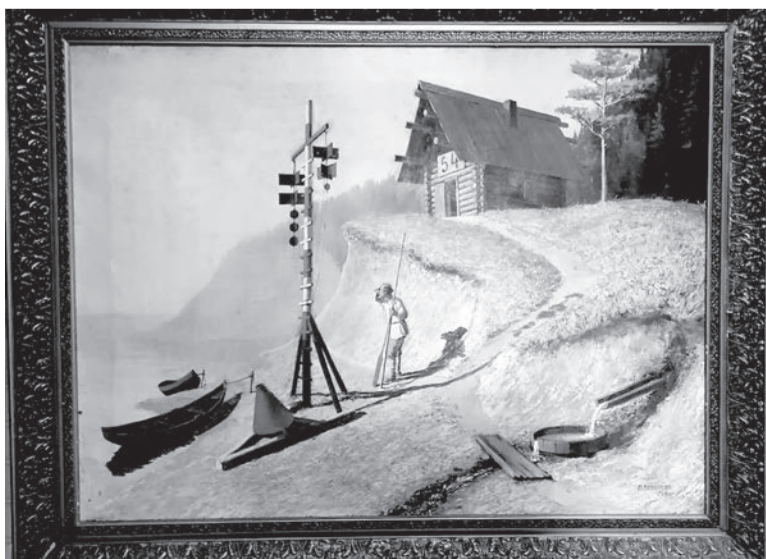
Картина П.П. Беркутова