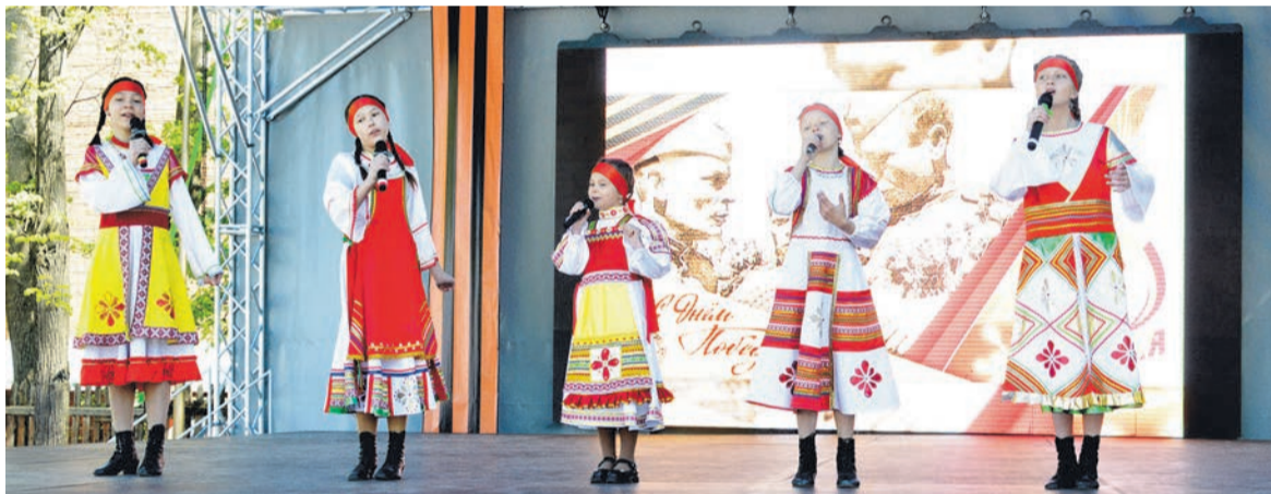
Фестиваль «Поющий май»