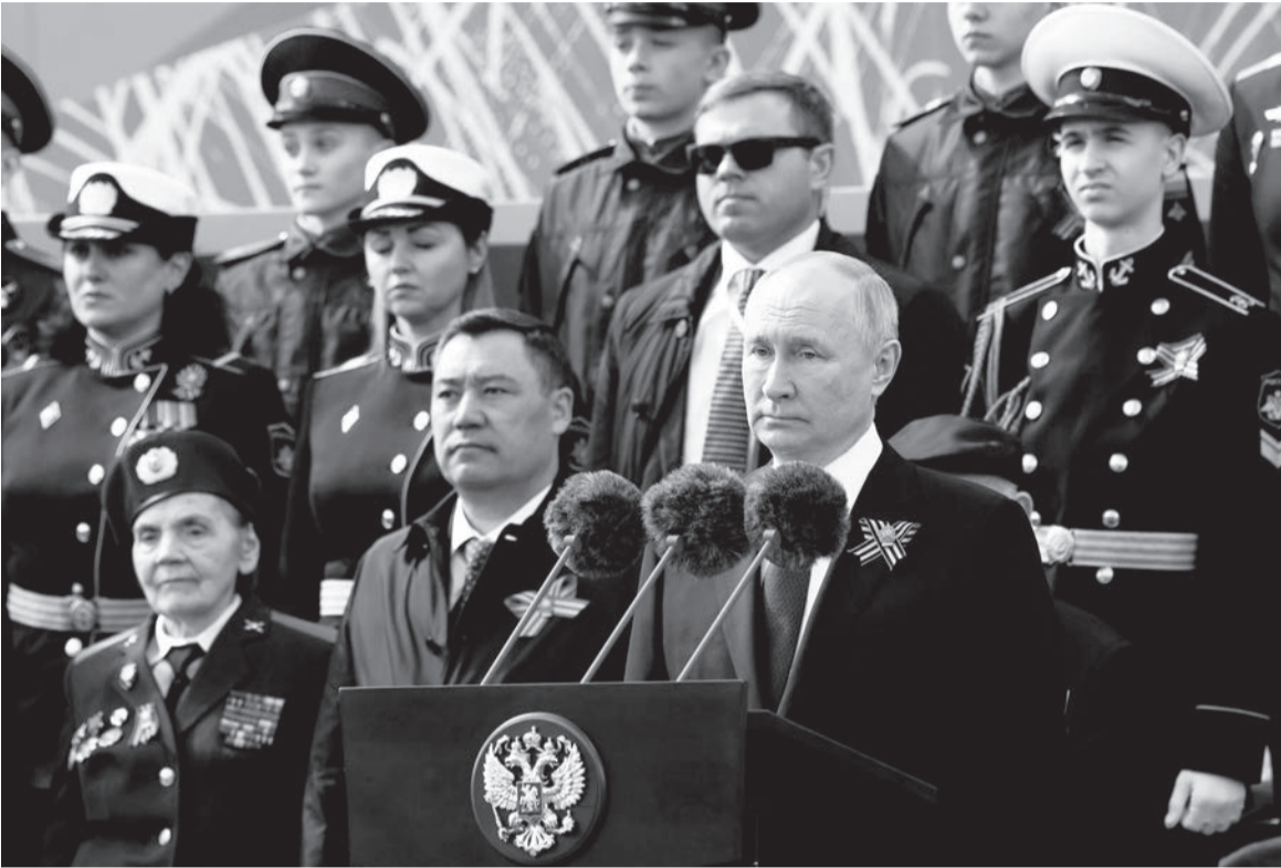
Выступление на военном параде в ознаменовании 78-й годовщины Победы в Великой Отечественной войне

Из выступления Президента России на военном параде на Красной площади 9 Мая