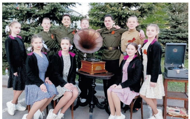
Атмосфера 1940-х годов