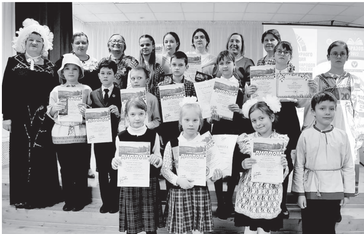
Призеры краеведческих чтений