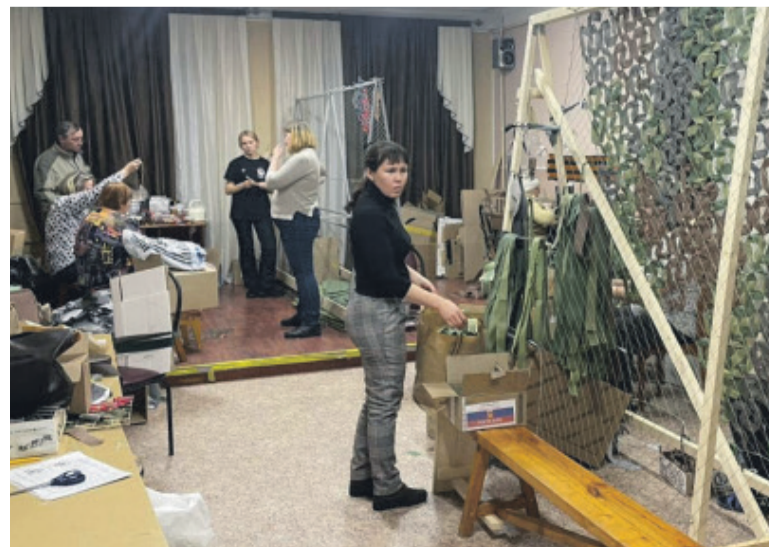
Работа в штабе по ул. Молодежной, 4 «кипит» ежедневно, кроме воскресенья