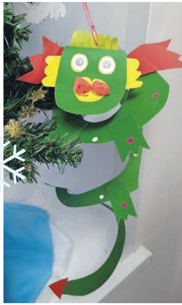
Дракончик Камиллы Садковой, детский сад № 20