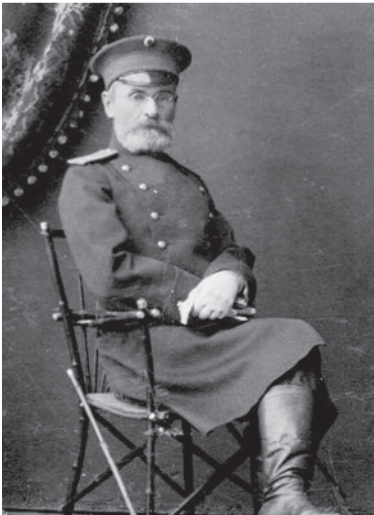
Эммануил Агафонович Чернышев