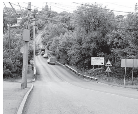
Обновленная улица Раскольникова

ул. Пролетарской до 3-го Дубровского пер., сделаны тротуары и установлены новые остановочные павильоны. Общая стоимость работ составила 90 млн рублей.