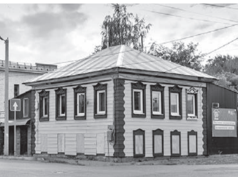
«Том Соьер Фест»: обновлен фасад дома по ул. Азина, 24

► Фондом П.А. Башенина в 2023 году разработана научно-проектная документация на восстановление фасадов зданий №№ 136, 148, 154 по ул. Раскольникова и № 2 по ул. Советской.