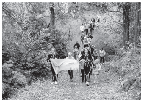
«Тропа здоровья» появилась в Ленинском парке

► Завершается реконструкция многофункционального спортивного центра «Позитрон».