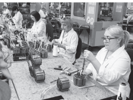
В одном из цехов Сарапульского электрогенераторного завода

► Основу экономики города составляют машиностроение, пищевая и легкая промышленность и цветочное производство.