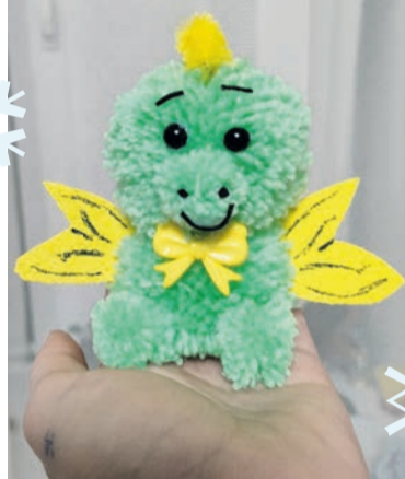
Такого пушистика-дракошу выполнила Есения Виноградова, 6 лет, детский сад № 16