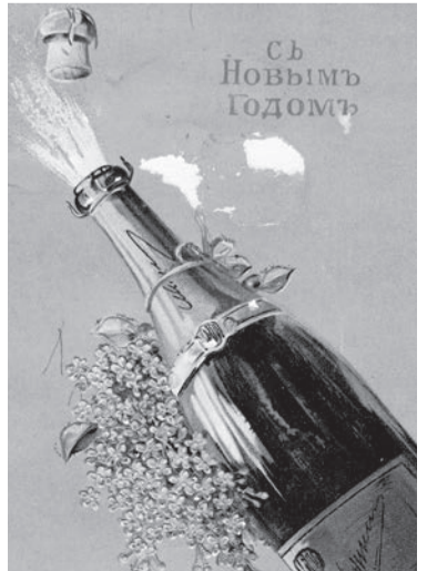
Поздравительная открытка, 1913 год