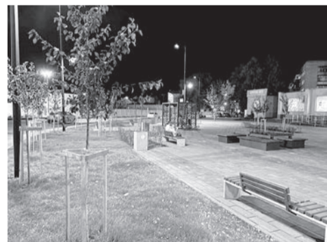
Новый облик приобретает площадь 200-летия Сарапула

► В рамках проекта «Формирование комфортной городской среды» («ФКГС») проводились работы по благоустройству общественного пространства – площади 200-летия Сарапула. Общая площадь благоустройства составила 3238,77 кв. метра, из них устройство тротуаров из брусчатки – 2109,3 кв. метра, площадь озеленения – 841,3 кв. метра, площадь парковок и карман для остановки маршрутного автобуса – 288,2 кв. метра. Установлено 11 опор со светильниками наружного освещения, а также пергола, скамейки, урны и т.д. Всего было освоено средств по объекту 23,9 млн рублей.