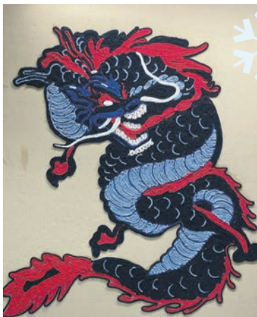
Этого китайского дракона из ниток для вязания выполнила Ирина Шкляева