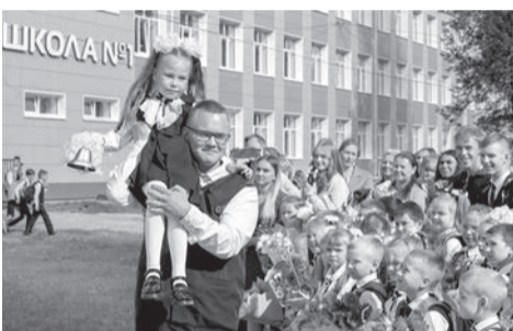
Завершен капитальный ремонт школы № 1

► В 2023 году распахнули свои двери после капитального ремонта школа № 1 и лицей № 26.