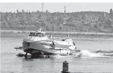
«Метеор» возвращается на Каму

► В 2023 году г. Сарапул посетили 112 339 туристов.