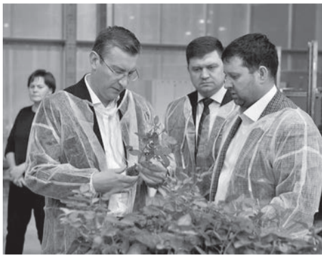
Председатель Правительства Удмуртии Ярослав Семенов и Глава г. Сарапула Виктор Шестаков знакомятся с продукцией ООО «Объединенная цветочная компания»

► На сегодняшний день статус резидента ТОР «Сарапул» имеют 27 компаний с общим объемом инвестиций (без НДС) – 6,6 млрд рублей и 5591 новыми рабочими местами.