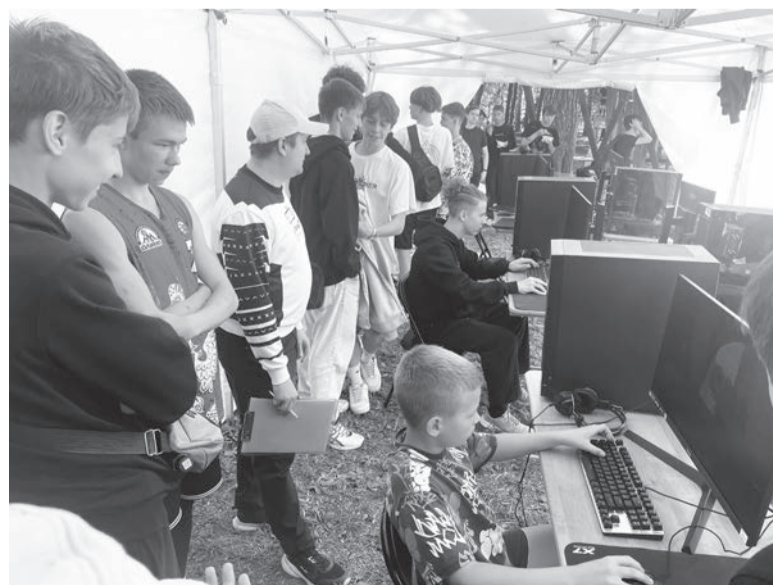
Турнир по компьютерной игре «Counter-Strike 3»