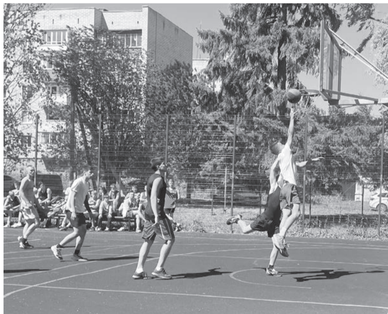
Турнир по стритболу вовлекает все больше участников