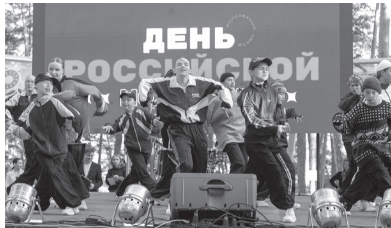
Концерт на сцене центральной аллеи Ленинского парка

С. Чувыгина.