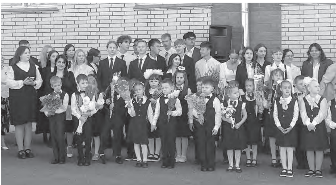
Одиннадцатиклассники вступают на финишную прямую, а первоклашки только начинают свой школьный путь