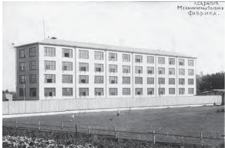
Сарапульская механическая фабрика обуви, 1929 год

Сарапульская обувная фабрика, вступившая в строй в сентябре 1929 года, – первая механическая фабрика обуви на Урале. Она появилась в нашем городе не случайно: на протяжении более столетия Сарапул славился кожевенно-обувным производством, здесь было много квалифицированных рабочих