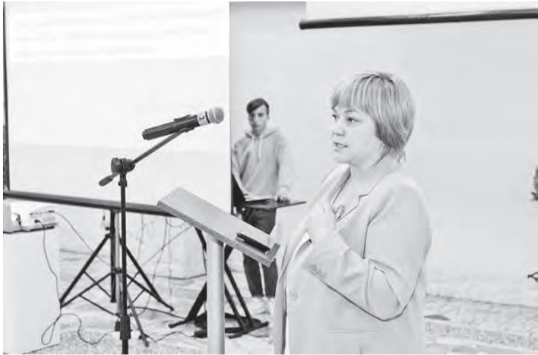
Первый заместитель министра здравоохранения Алсу Ишниязова

23 августа в Сарапуле состоялся зональный семинар по вопросам взаимодействия медицинских организаций в деле лечения и профилактики наркологических и алкоголь-ассоциированных заболеваний