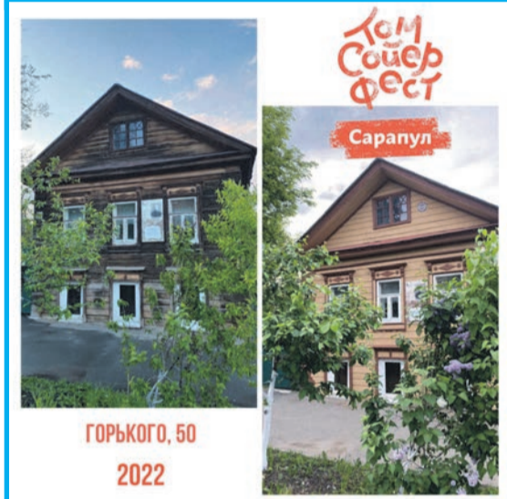
ГОРЬКОГО, 50 2022