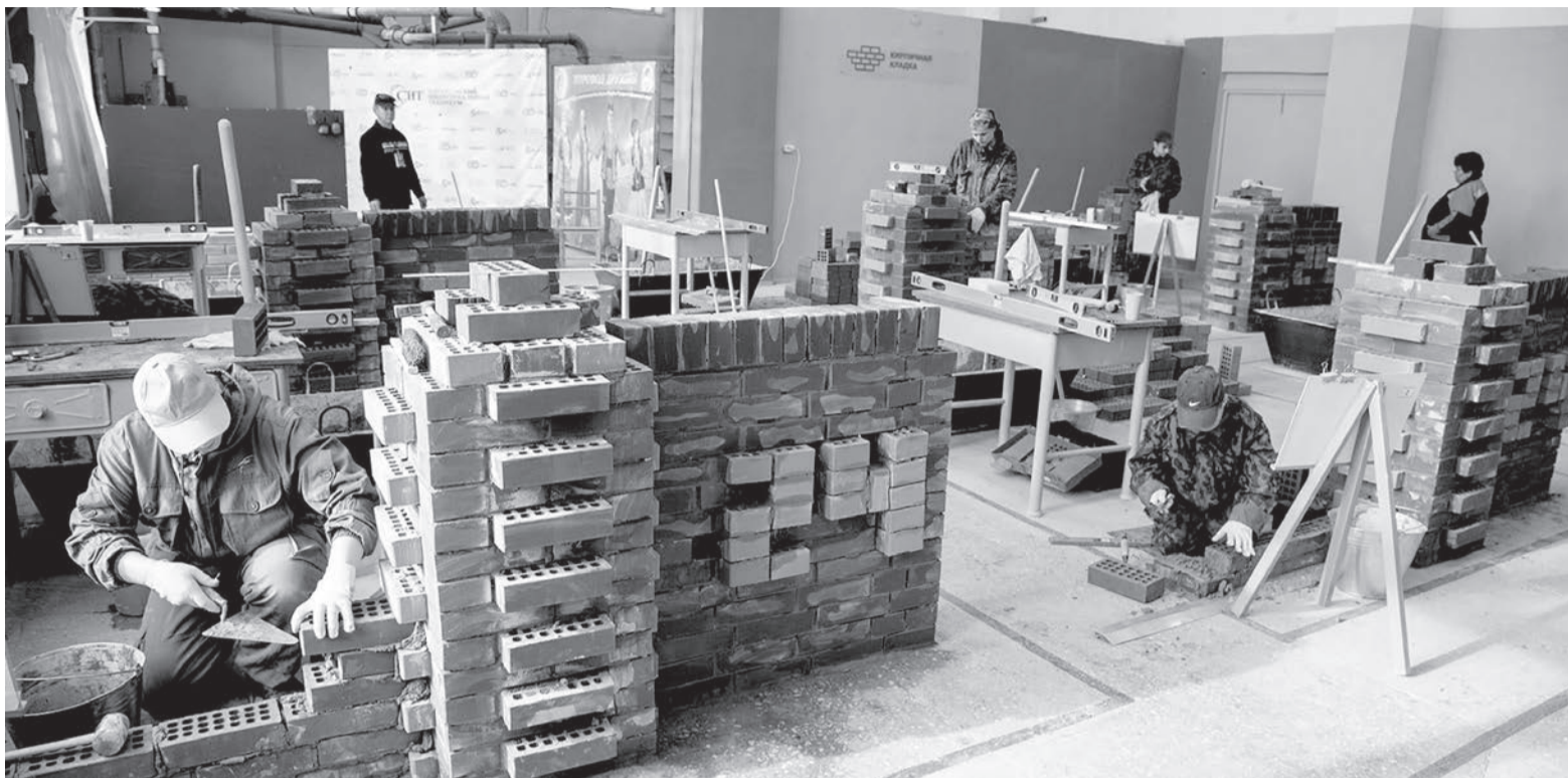
Площадка по компетенции «Кирпичная кладка»

С 26 февраля по 6 марта в Удмуртии состоялся региональный этап чемпионата по профессиональному мастерству «Профессионалы» федерального проекта «Профессионалитет», действующего в рамках госпрограммы по социально-экономическому развитию России и рассчитанному на период до 2030 года. В Сарапуле одной из площадок проведения чемпионата стала мастерская по компетенции «Кирпичная кладка» Сарапульского индустриального техникума