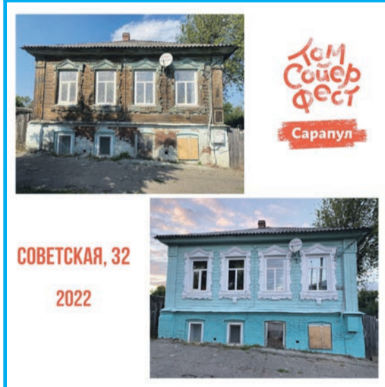
СОВЕТСКАЯ, 32 2022