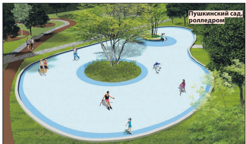
Пушкинский сад, ролледром