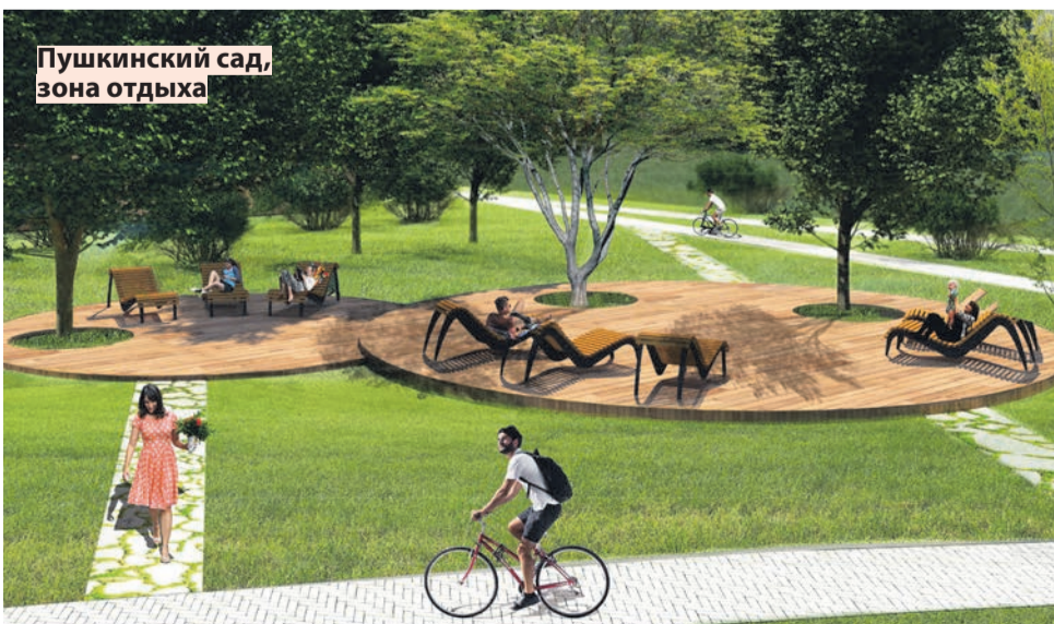
Пушкинский сад, зона отдыха

Такие объекты могут появиться в городском саду им. А.С. Пушкина