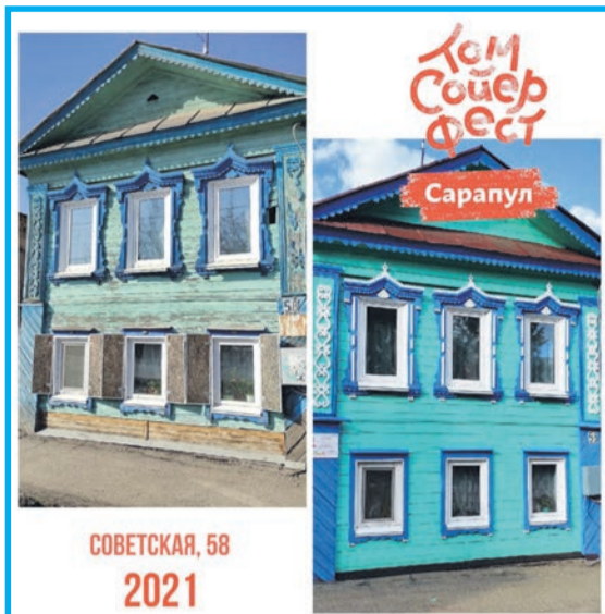
СОВЕТСКАЯ, 58 2021