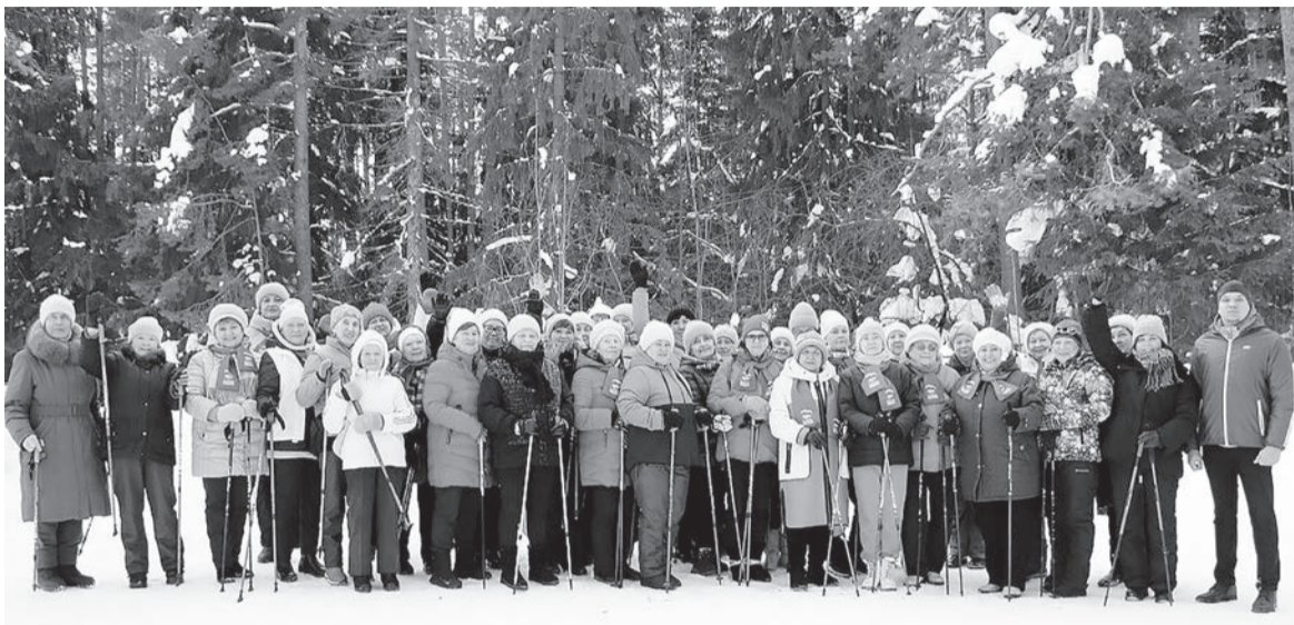
Участники физкультурно-спортивных клубов проекта «Удмуртское долголетие 2.0»

Проект «Удмуртское долголетие», стартовавший 1 августа 2022 года в результате победы Региональной общественной организации «Федерация скандинавской ходьбы Удмуртии» в Фонде президентских грантов, успешно реализуется на территории всех муниципальных образований региона и соответствует целям национального проекта «Демография», инициированного Президентом страны В.В. Путиным