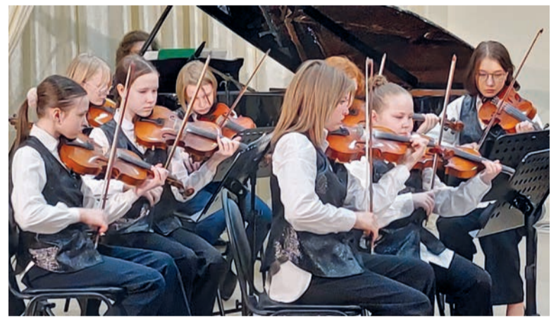
Группа скрипачей эстрадно-симфонического оркестра