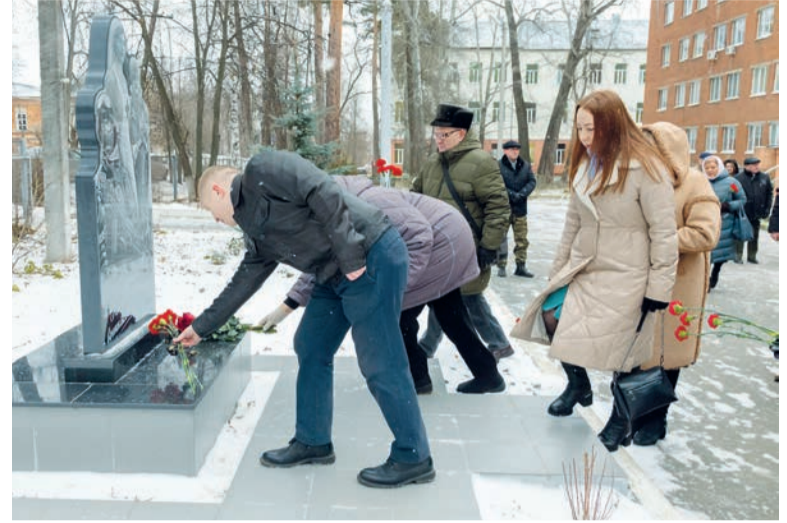
Участники общегородской акции возлагают цветы к памятнику военным медикам