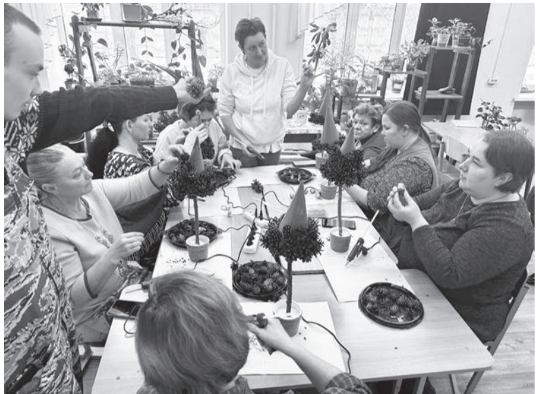
Мастер-класс по изготовлению новогодних елок

В Сарапульском многопрофильном колледже (бывший колледж для инвалидов) прошло мероприятие, посвященное Дню неизвестного солдата