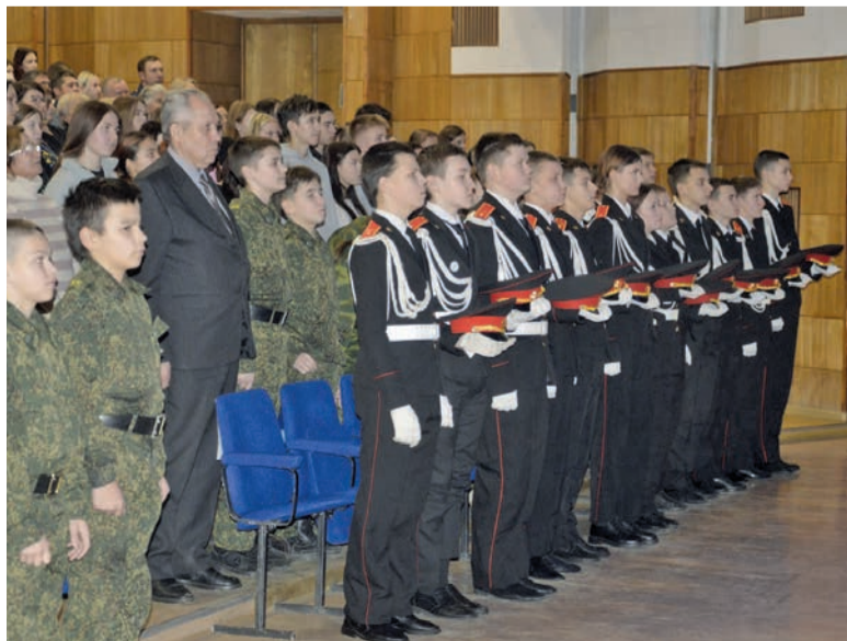
Видеопоза фотографий героев участники мероприятия смотрели стоя