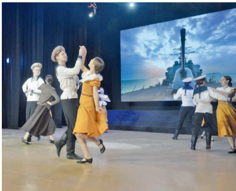
Танец моряков в исполнении коллектива «Радость»