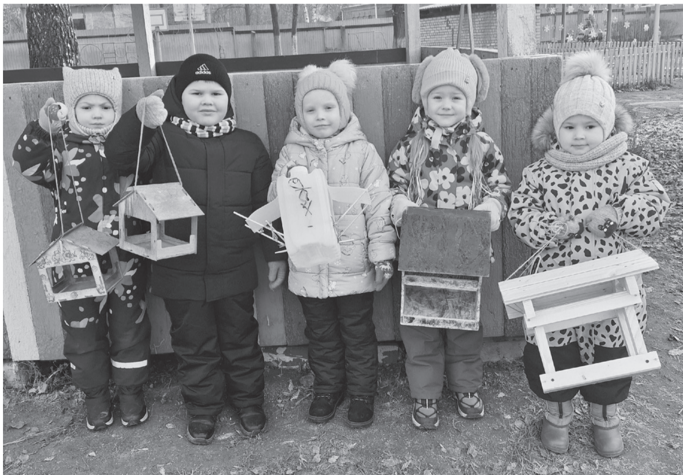
Старшая группа «Ромашки» детского сада № 37