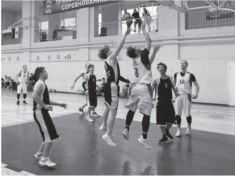
Момент игры между баскетбольными командами Сарапульского радиозавода и завода «Элеконд»

В Сарапуле стартовал масштабный и уникальный в своем роде спортивный фестиваль среди предприятий и организаций города «Наша Победа», посвященный 80-й годовщине Победы в Великой Отечественной войне