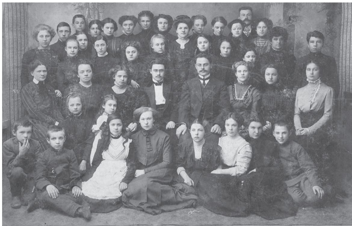
Учащиеся и преподаватели Сарапульских музыкальных классов, 1911-1912 годы.