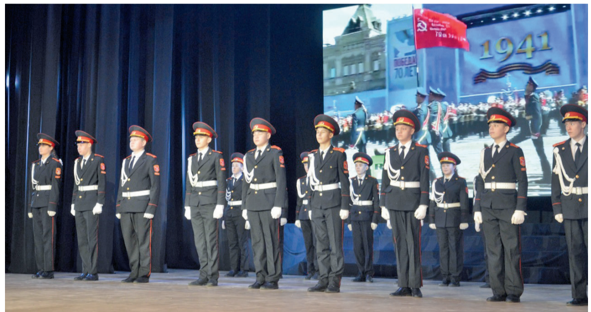
Слаженно и уверенно маршировали кадеты школы № 2