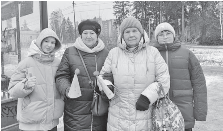
Волонтеры школы № 13 проводят акцию «СТОП ЕЛКА»

В преддверии новогодних праздников, когда весь мир замирает в ожидании чудес и волшебства, волонтеры 6 класса школы № 13 вместе с классным руководителем провели акцию против несанкционированной рубки новогодних деревьев