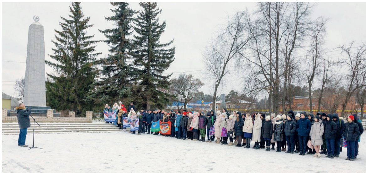
Памятный митинг на площади Мужества