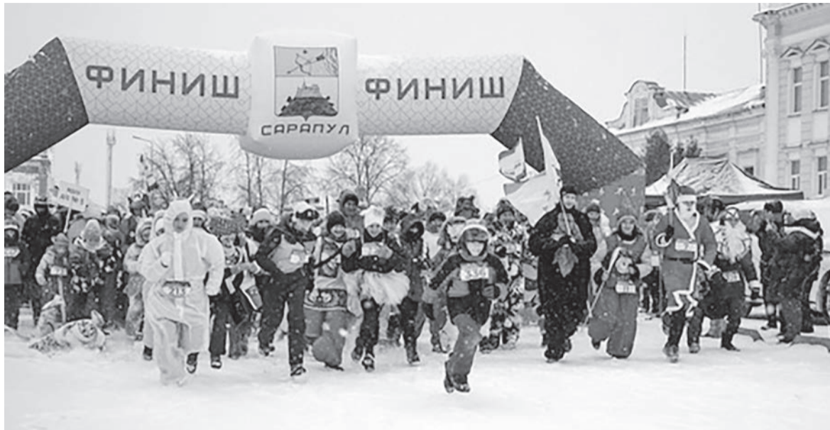
Старт участников карнавального забега «Сарпульская верста» в 2023 году

В дни новогодних каникул жителей и гостей Сарпула ждет большое разнообразие городских массовых мероприятий, которые помогут окунуться в мир новогоднего волшебства: новогодние шоу-программы, спектакли, дискотеки, рождественские народные гуляния, спортивные состязания, квесты и уникальные экскурсии