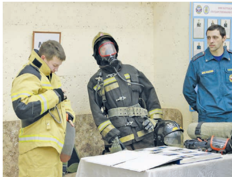
На выставке в ДК «Электрон» можно было примерить экипировку спасателей