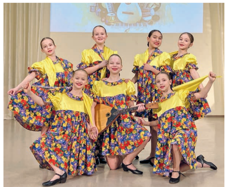
Хореографический ансамбль «Грация»