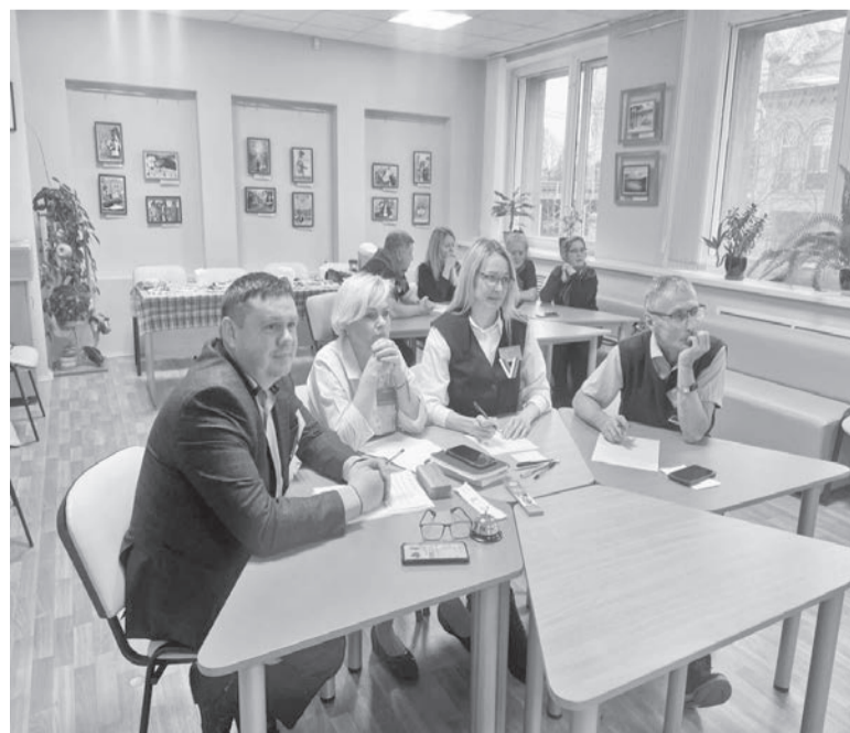
Участники интеллектуальной игры «Выборы. Я знаю!»

Завершается прием заявок на участие в всероссийском конкурсе «Атмосфера»