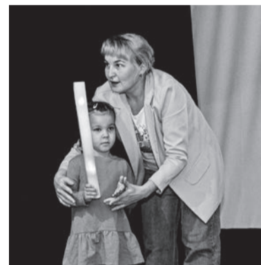
У психолога - особый подход к каждому ребенку

К работе логопеда активно подключаются и родители