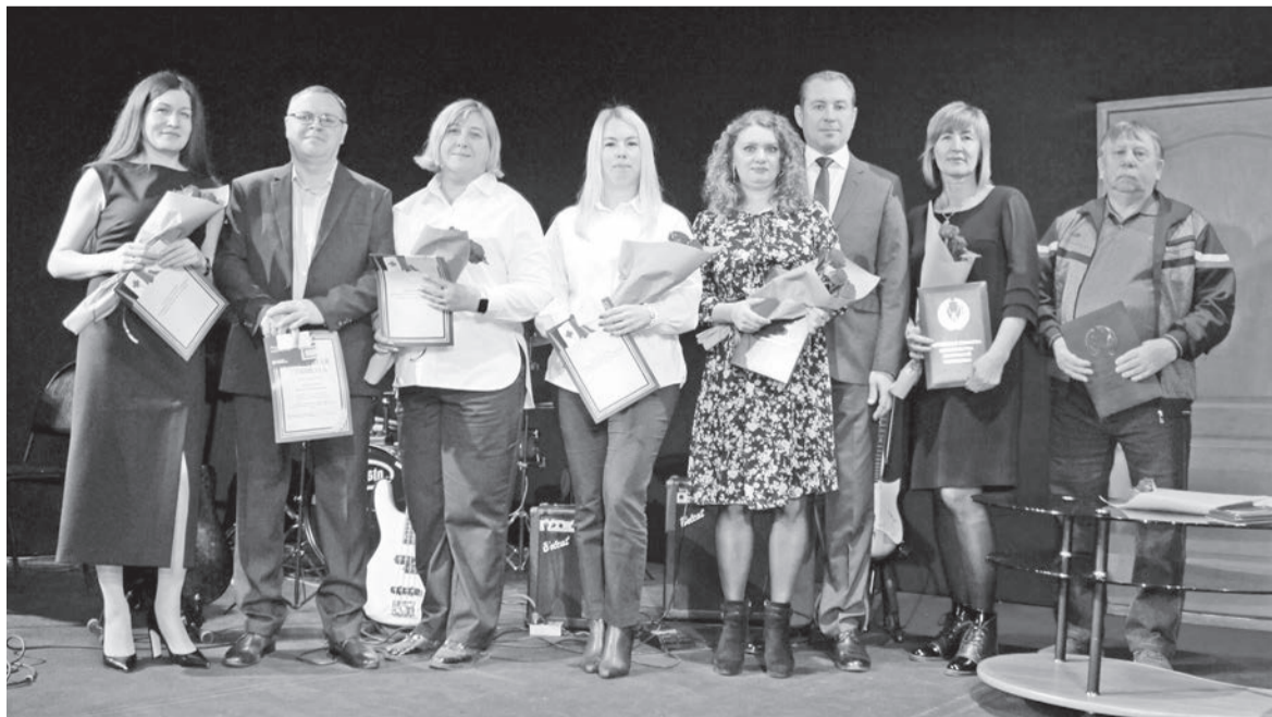
Награждение почетными грамотами Министерства промышленности и торговли УР, Государственного Совета УР, Правительства УР