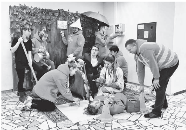
Подготовка одной из команд к фотоконкурсу «Фотозона от «Озона»