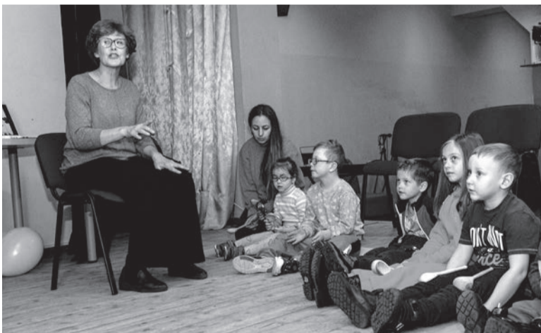
К работе логопеда активно подключаются и родители