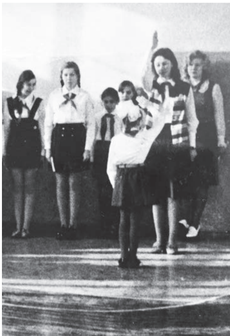
Торжественная линейка, посвященная Н. Островскому. 1976 год

29 сентября исполнилось 120 лет со дня рождения советского писателя Николая Алексеевича Островского