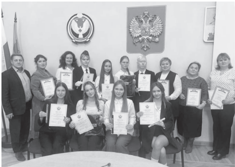
Победители и призеры городской олимпиады «Я - избиратель»

Ученики старших классов сарапульских школ приняли участие в городской олимпиаде «Я - избиратель», организованной Территориальной избирательной комиссией совместно с Управлением образования города Сарапула, победители которого представят город на республиканской олимпиаде