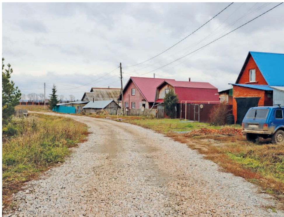
Улица Лазурная в микрорайоне «Гудок-2»

Жители Сарпула продолжают принимать участие в республиканских программах «Самообложение» и «Инициативное бюджетирование» по щебенению дорог, освещению, строительству спортивных площадок и других проектов по благоустройству территорий