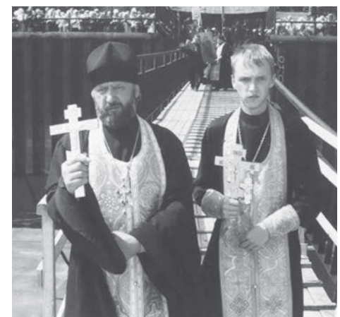
Сарапульский Казанский крестный ход с иконой Святителя и Чудотворца Николая, 2009 г. (Ф. Р-865. Оп. 1. Д. 202)

15 лет назад, в 2009 году возрождена традиция Сарапульского Казанского крестного хода, проходившего регулярно до 1918 года в память об избавлении жителей города Сарапула и его окрестностей от эпидемии «моровой язвы» (чумы) 1657 года, принесением из с. Николо-Березовка иконы Святителя Николая.