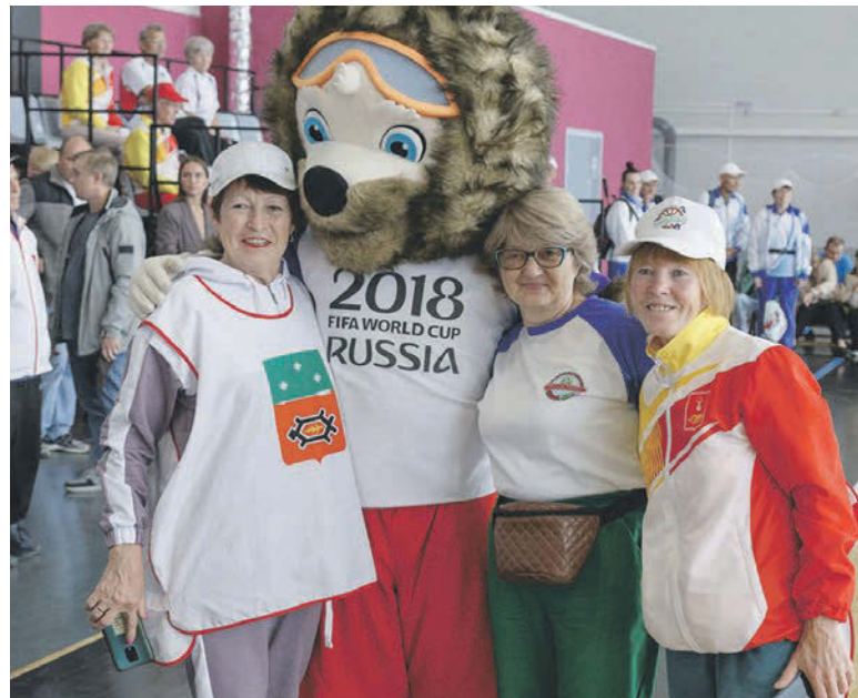
Удачи всем спортсменам пожелал Забивака