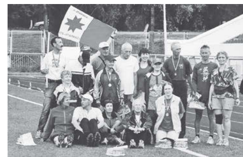
Призеры и участники Всероссийского легкоатлетического пробега на призы ОАО «Сарапульский хлебокомбинат» на игровом поле стадиона «Сокол», 2012 г. (Ф. Р-750. Оп. 5Ф. Д. 1223)