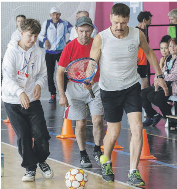
Участники из Сарапула борются за призовое место в комбинированной эстафете