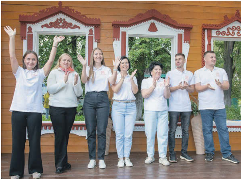
Дружная команда проекта «Том Соьер Фест»

На минувшей неделе в Сарапуле состоялось торжественное открытие сквера «Том Соьер Фест – Городская среда» на пересечении улиц К. Маркса и Первомайской. Это событие стало настоящим праздником не только для команды проекта, но и для многих горожан