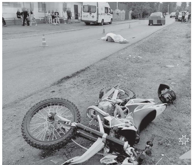
19 июня в Завьялово погиб 15-летний парень, выехавший на своем питбайке со второстепенной дороги и столкнувшийся с автомобилем ВАЗ-2110