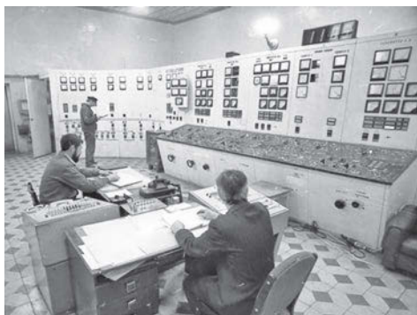
Главный пульт управления ТЭЦ, 1981 г. (Ф. Р-750. Оп. 2Ф. Д. 860)

80 лет назад, в 1944 году была введена в строй Сарапульская теплоэлектроцентраль (ТЭЦ).