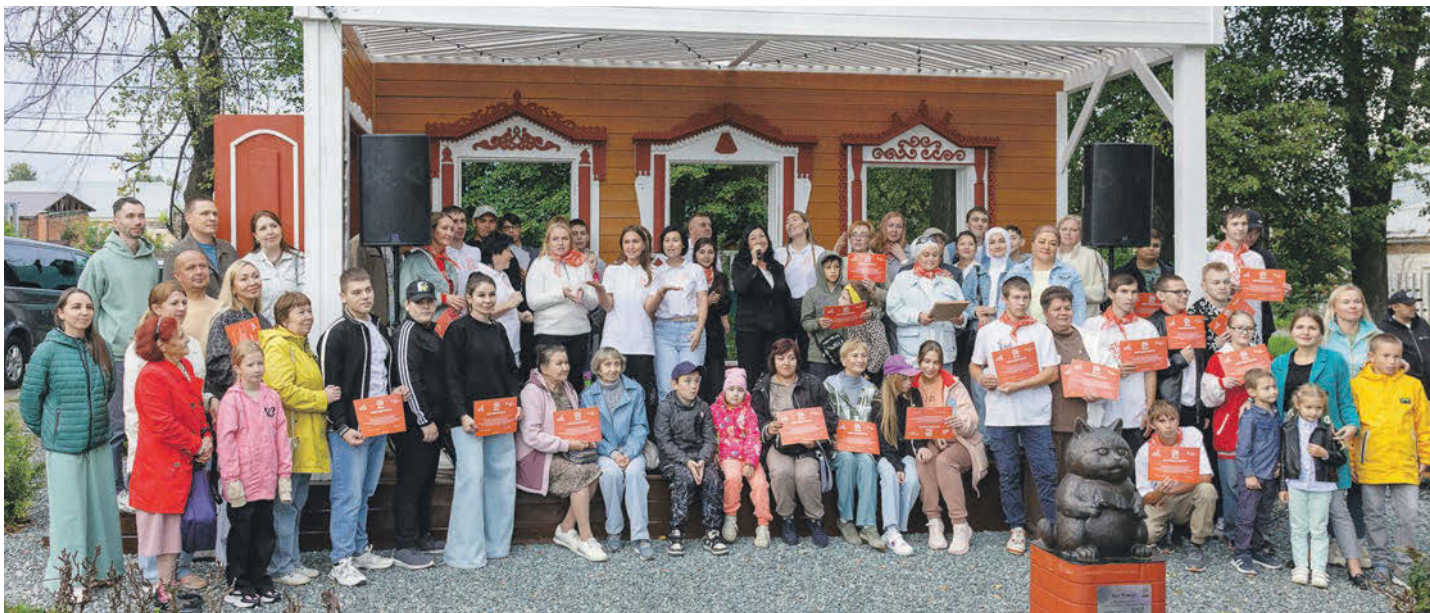
Организаторы, волонтеры, жители города - новому скверу рады все!

В осторг и удивление – именно эти эмоции невольно возникают у всех, кто впервые оказывается на площадке нового городского пространства. Особенную радость испытывают те, кто видел, что было раньше на этом месте. Вместо густой поросли, строительного и другого мусора здесь воцарилась идиллия красоты и функциональности. Центральное место заняла беседка-ротонда с окнами, украшенными резными наличниками, здесь же расположились удобные скамейки для приятного времяпрепровождения, комфортные пешеходные дорожки, цветы и другие зеленые растения. Почетное место занял и хранитель сквера – кот Томас, уже ставший любимым персонажем ярких фотосессий. А еще настоящим украшением сквера стал мурал, появившийся на фасаде рядом расположенного дома. Такого преображения мало кто ждал, но профессионалы сделали свое дело на «отлично».