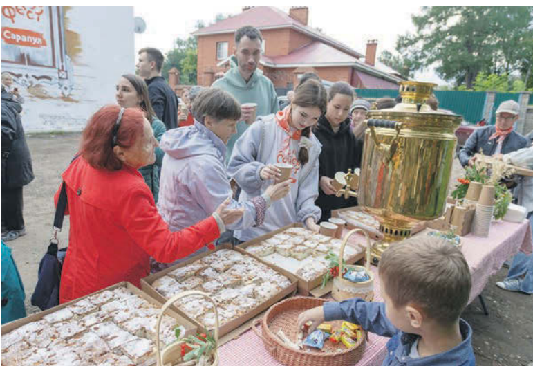
Вкусное завершение праздника