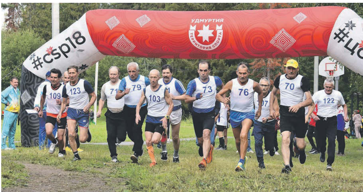
«Серебряные» легкоатлеты - пример для молодых