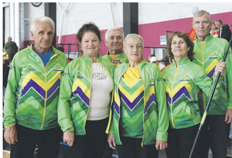
Улыбчивая команда Камбарского района готова к стартам