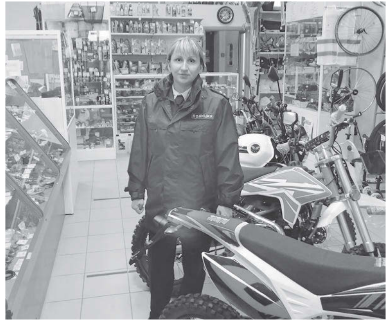
Сотрудники Госавтоинспекции г. Сарапула разъясняют правила, связанные с управлением питбайком, в пунктах продажи мототранспорта

В рамках четвертого этапа профилактического мероприятия «Мотоциклист», проведенного с 1 по 10 августа на подведомственной отделу МО МВД России «Сарапульский» территории, выявлены самые распространенные нарушения - отсутствие регистрации транспорта, прав на управление им, шлема безопасности, а также езда в пьяном виде.