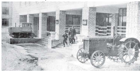
Здание главного корпуса Сарапульского профессионально-технического училища № 3, 1983 г. (Ф. Р-750. Оп. 1Ф. Д. 1669)

ское профессиональное училище № 26 Министерства просвещения УАССР, с 2013 года - БПОУ УР «Сарапульский политехнический техникум» (в 2022 году вошел в состав БПОУ УР «Сарапульский колледж социально-педагогических технологий и сервиса»).