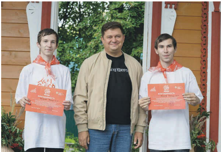
Один из приятных моментов - награждение волонтеров