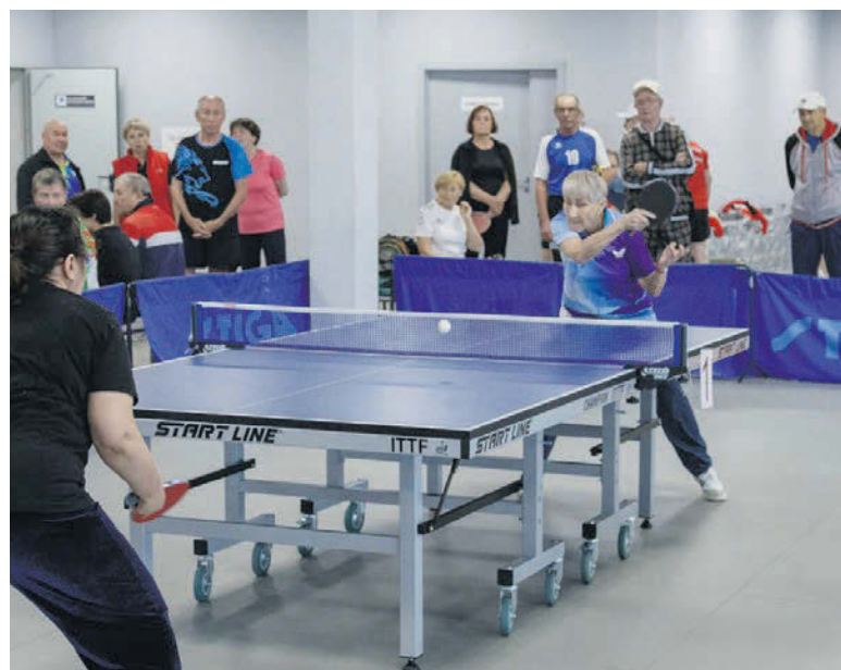
В соревнованиях по настольному теннису «кипели» страсти