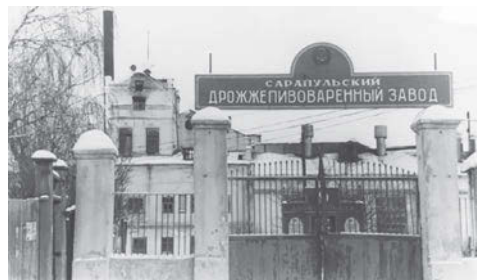
Центральные ворота Сарапульского дрожжепивоваренного завода (Ф. Р-848. Оп. 2. Д. 613)

100 лет назад, в 1924 году Сарапульским промкомбинатом на базе завода безалкогольных напитков был введен в строй пивоваренный завод с годовой производительностью 20 000 гектолитров продукции. Для варки пива огнем способом приглашен был иностранный специалист. В 1963 году пивоваренный завод был объединен с дрожжевым заводом в Сарапульский дрожжепивоваренный завод. Ныне - ЗАО «Сарапульский дрожжепивзавод».