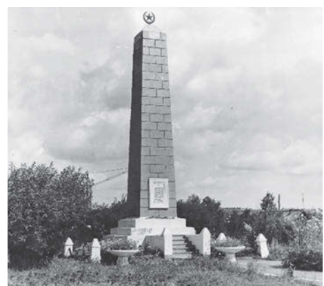
Обелиск 62-м красноармейцам, расстрелянным белогвардейцами 11 апреля 1919 года на площади Братских могил в городе Сарапуле, 1980 г. (Ф. Р-750. Оп. 1Ф. Д. 15869)

65 лет назад, в 1959 году установлен обелиск на братской могиле 62-х красноармейцев 44-го Пензенского полка, в апреле 1919 года попавших в плен около станции Армязь и расстрелянных колчаковцами в г. Сарапуле. Автор проекта памятника - архитектор Н. Крыжановский.