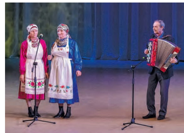
Семейный дуэт «Сестры», с. Шевырялово