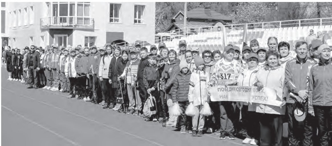
Торжественное построение участников фестиваля на стадионе «Энергия»

16 мая в Сарапуле прошел весенний фестиваль «Удмуртское долголетие 2.0», который собрал спортсменов из разных городов и районов республики