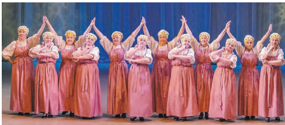
Танцевальный коллектив «Мы с ЭГЗ» с танцем «Настроение»