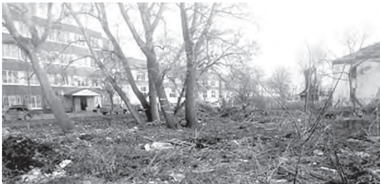
Территория по ул. 1-й Заводской сейчас

Уважаемые предприниматели славного купеческого города Сарапула! Поздравляем вас с профессиональным праздником! Желаем всем крепкого здоровья, успехов и развития!