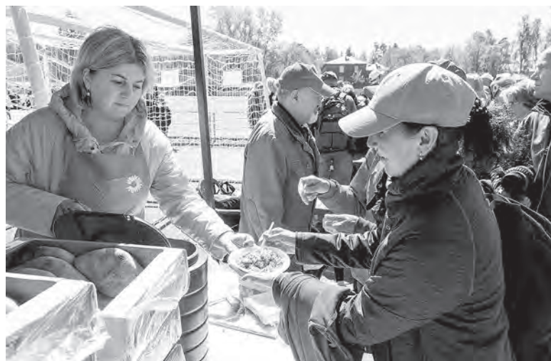
Гостей Сарапула угощают горячим обедом