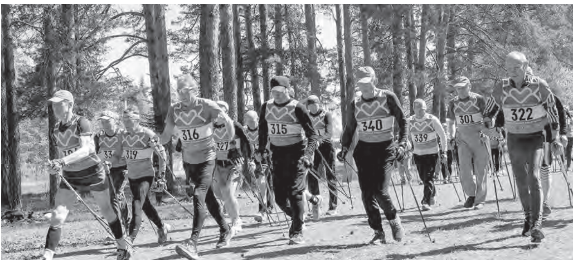
Старт соревнований по северной ходьбе среди мужчин