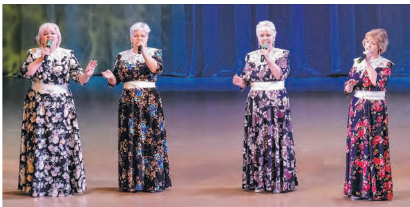
Семейный вокальный квартет Дворца культуры «Электрон»