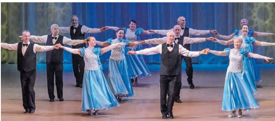
Группа «Азарт» школы танца «Вдохновение»