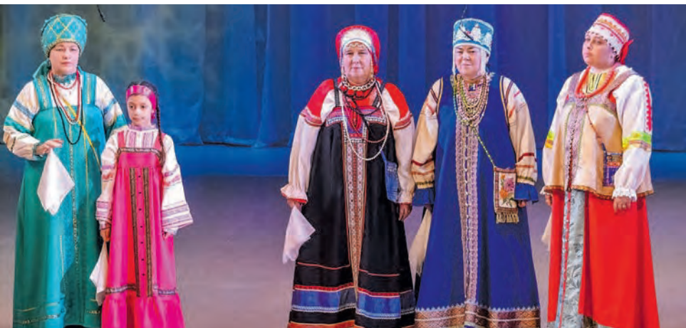
Народный русский фольклорный ансамбль «Отрада» ДК радиозавода