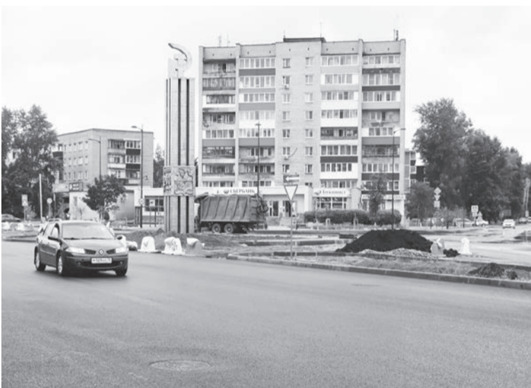
На площади 200-летия Сарапула работы продолжаются