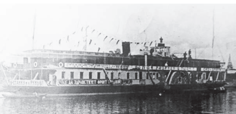
Пароход «Красная Звезда».