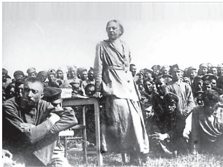
Н.К. Крупская на красноармейском митинге

«Сообщение о прибытии в Сарапул парохода «Красная Звезда», на котором на-