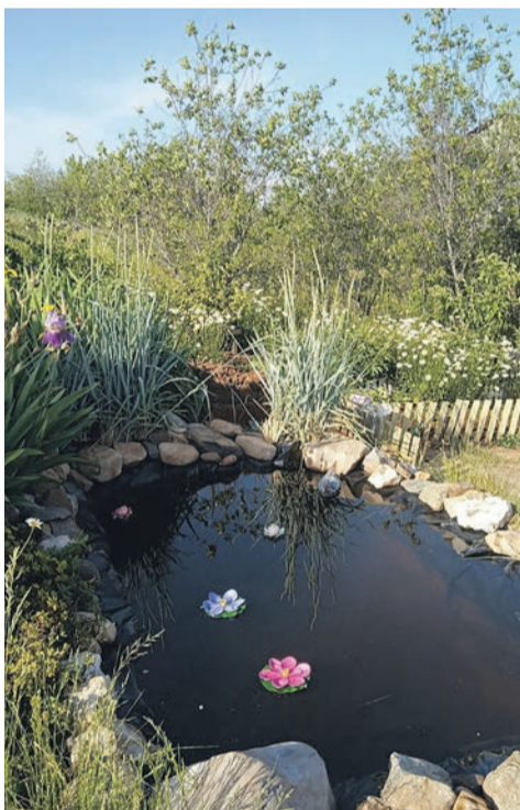
Любовь Сомова сделала на своем участке искусственный водоем