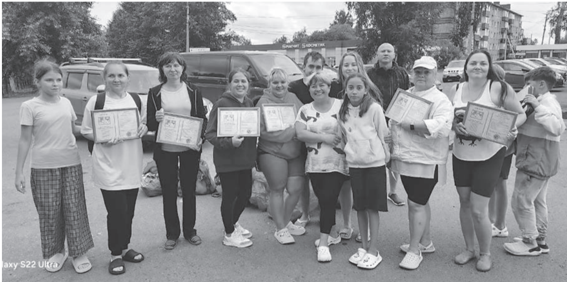
Дружный коллектив магазина «Букинист» вместе со своими семьями отпраздновал юбилей, отправившись на сплав по реке

Знакомый с детства и любимый многими сарапульцами магазин... Здесь нам покупали первые в жизни книжки, а наши мамы и бабушки приобретали себе художественную литературу и издания по кулинарии. В этом году 30-летие со дня своего основания отмечает «Букинист»