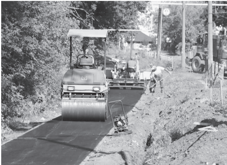
Ремонт тротуара по улице Дубровской