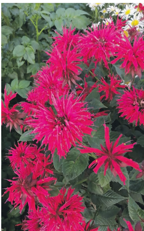
Сад Светланы Шакировой утопает в цветах