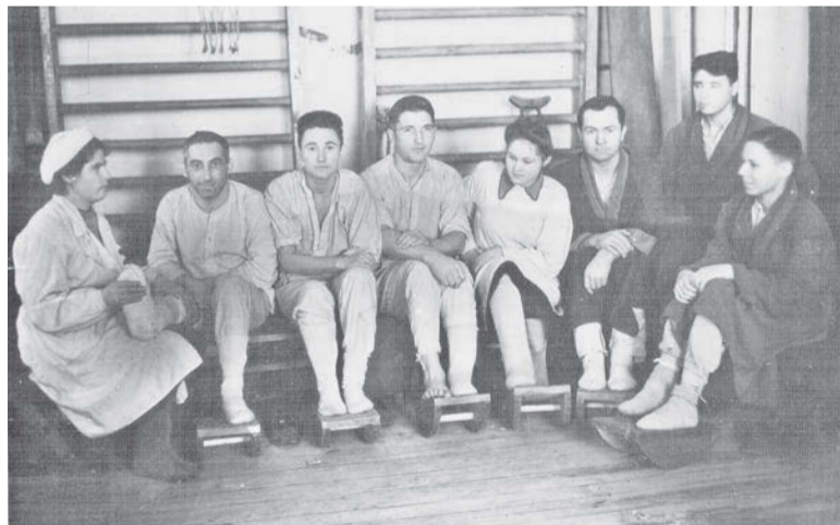
Занятие лечебной физкультурой в эвакуогоспитале № 3892