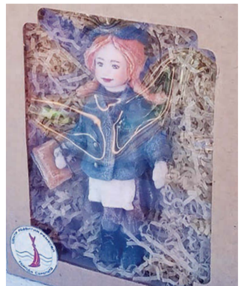
Кукла, ставшая призером фестиваля-конкурса туристического сувенира «Привет с Камы»