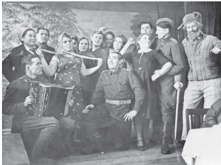
Художественная самодеятельность эвакуогоспиталя № 3892