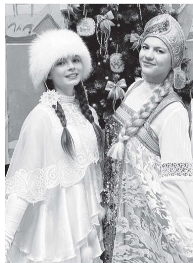
Девица Метелица и Золотая Сарапула