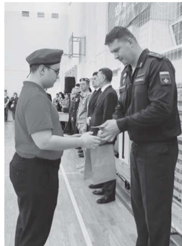
Торжественное вручение юнармейских книжек и значков