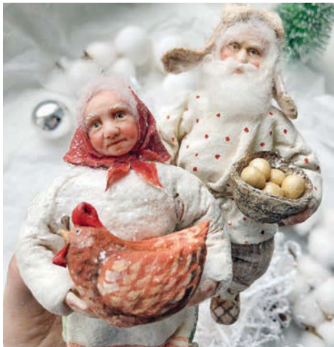
Игрушки по сказке «Курочка Ряба»