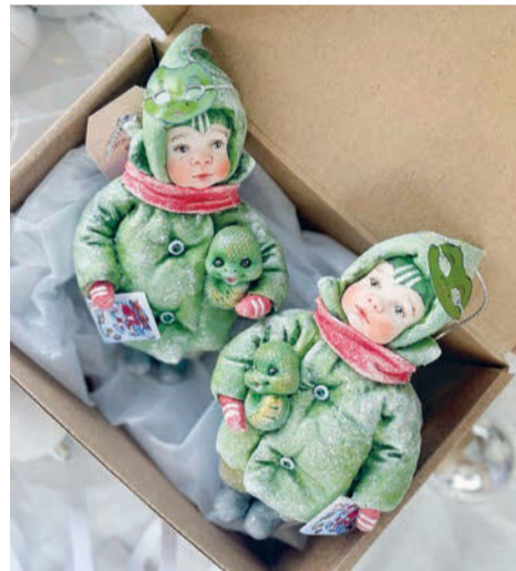
Игрушки из новогодней серии