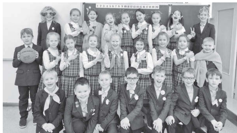
Успешные и талантливые ученики - главная гордость лицея