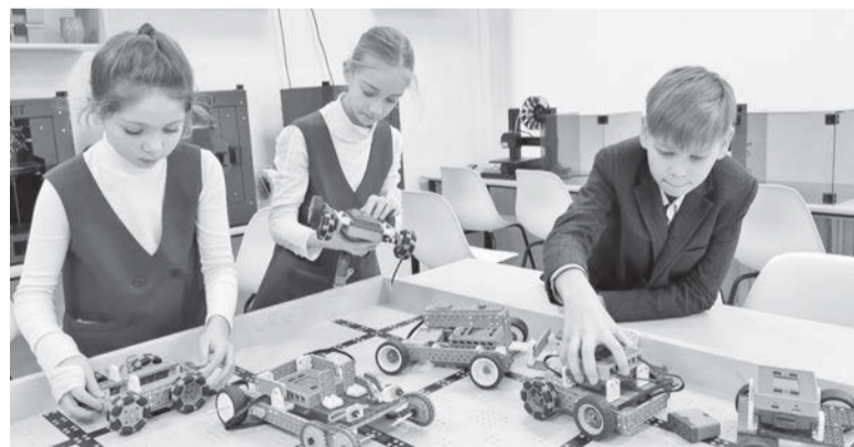
Школьный «Кванториум» - место притяжения