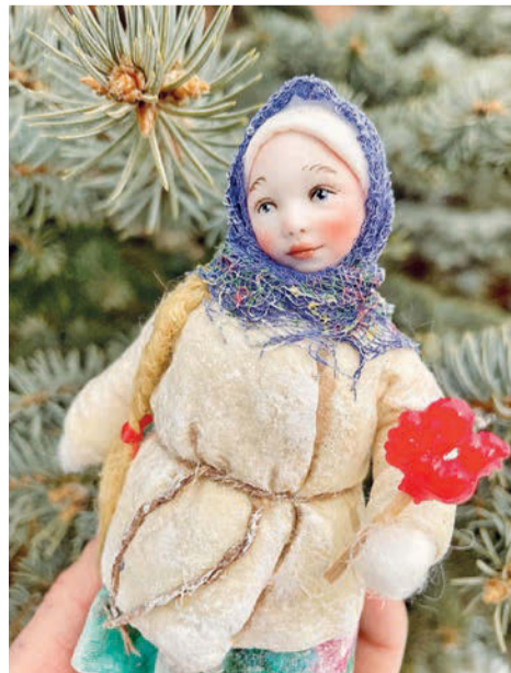
Игрушки «Русская краса»