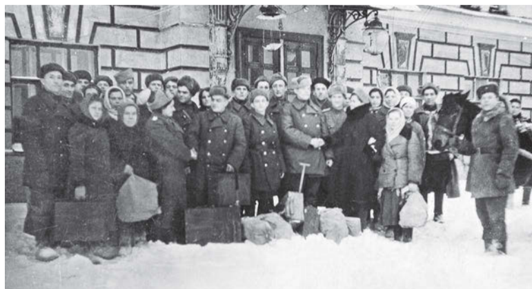
Проводы демобилизованных из госпиталя № 3892, 1946 год

М. Шитова, заведующая отделом научных исследований и экспозиций Сарапульского музея-заповедника.