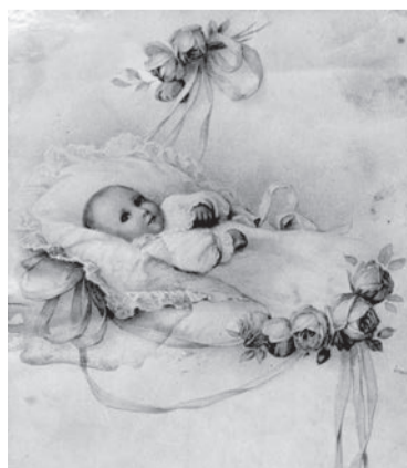
Новорожденный младенец. Почтовая открытка начала XX века