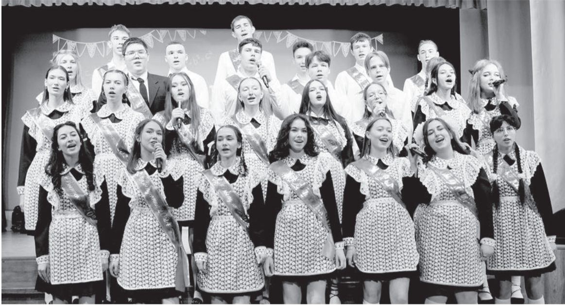
Выпускники Сигаевской школы исполняют прощальную песню

25 мая – особенный день. Немного грустный, но в то же время очень долгожданный. Традиционно именно в этот день выпускники, их родители, педагоги собираются вместе на Последний звонок