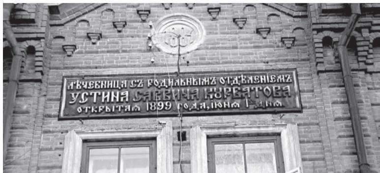
Памятная табличка на здании по ул. Гоголя, 32.

Сто двадцать пять лет назад, 1 июня 1899 года, в Сарапуле открылось учреждение, миссией которого была охрана жизни и здоровья новорожденных детей и их матерей