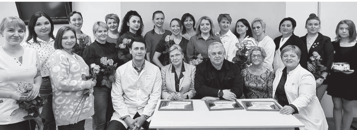
Участники конкурса видеопрезентации

В этом году мероприятие поменяло свой формат и прошло в виде конкурса видеопрезентаций и видеороликов «Сестра милосердия: взгляд через годы». При подготовке задания можно было выбрать вариант из нескольких номинаций: роль медицинской сестры в истории, в обществе, сестринское сообщество как единая семья, наставничество в сестринской профессии и др.