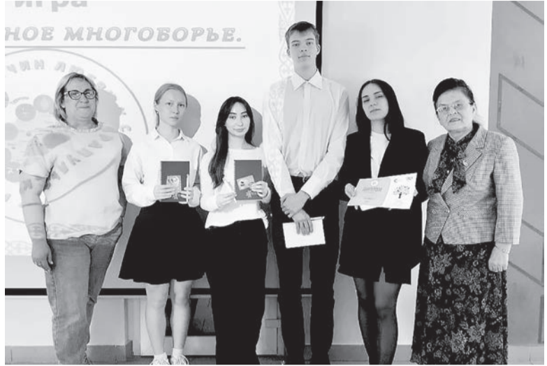
Команда «Ваёбыж» («Ласточка») Сигаевской школы

Ученики 10 «а» класса Сигаевской школы – лучшие в интеллектуальных поединках