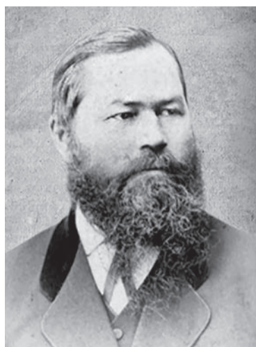
Устин Саввич Курбатов (1827–1885)

Согласно Первой Всероссийской переписи населения 1897 года, в Сарапуле проживало чуть больше двадцати одной тысячи человек. В 1899 году, по данным Памятной книжки Вятской губернии на 1900 год (с. 34-35), в Сарапуле родилось 520 законнорожденных младенцев: 276 мальчиков и 244 девочки, и 21 незаконнорожденный ребенок. Услугами только что открывшегося родовспомогательного заведения воспользовались 145 рожениц, из них первородящих – 41. Всего на свет здесь появилось 65 мальчиков и 70 девочек. 15 новорожденных спасти не удалось.