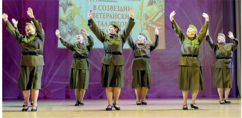
Группа «Азарт» Школы танцев для взрослых «Вдохновение» Дворца культуры радиозавода, лауреаты I степени в номинации «Хореографическое искусство»