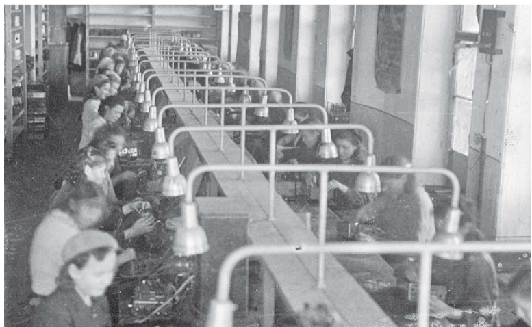
Сборочный цех радиозавода