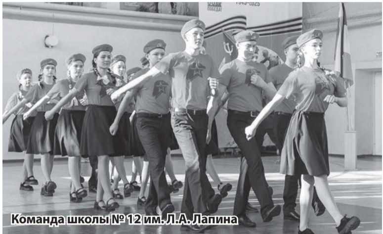
Команда школы № 12 им. Л.А. Лапина

В последний день февраля в Сарапуле состоялся муниципальный этап Республиканского смотра-конкурса по строевой подготовке «Равняемся на Героев» в рамках государственной программы Удмуртии «Развитие молодежной политики в Удмуртской Республике»