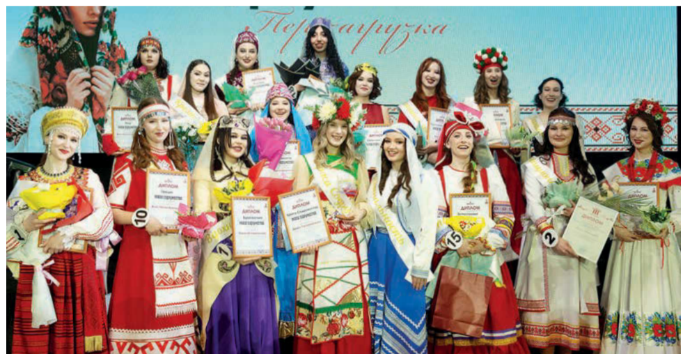
Финалистки конкурса «Краса Содружества. Перезагрузка»