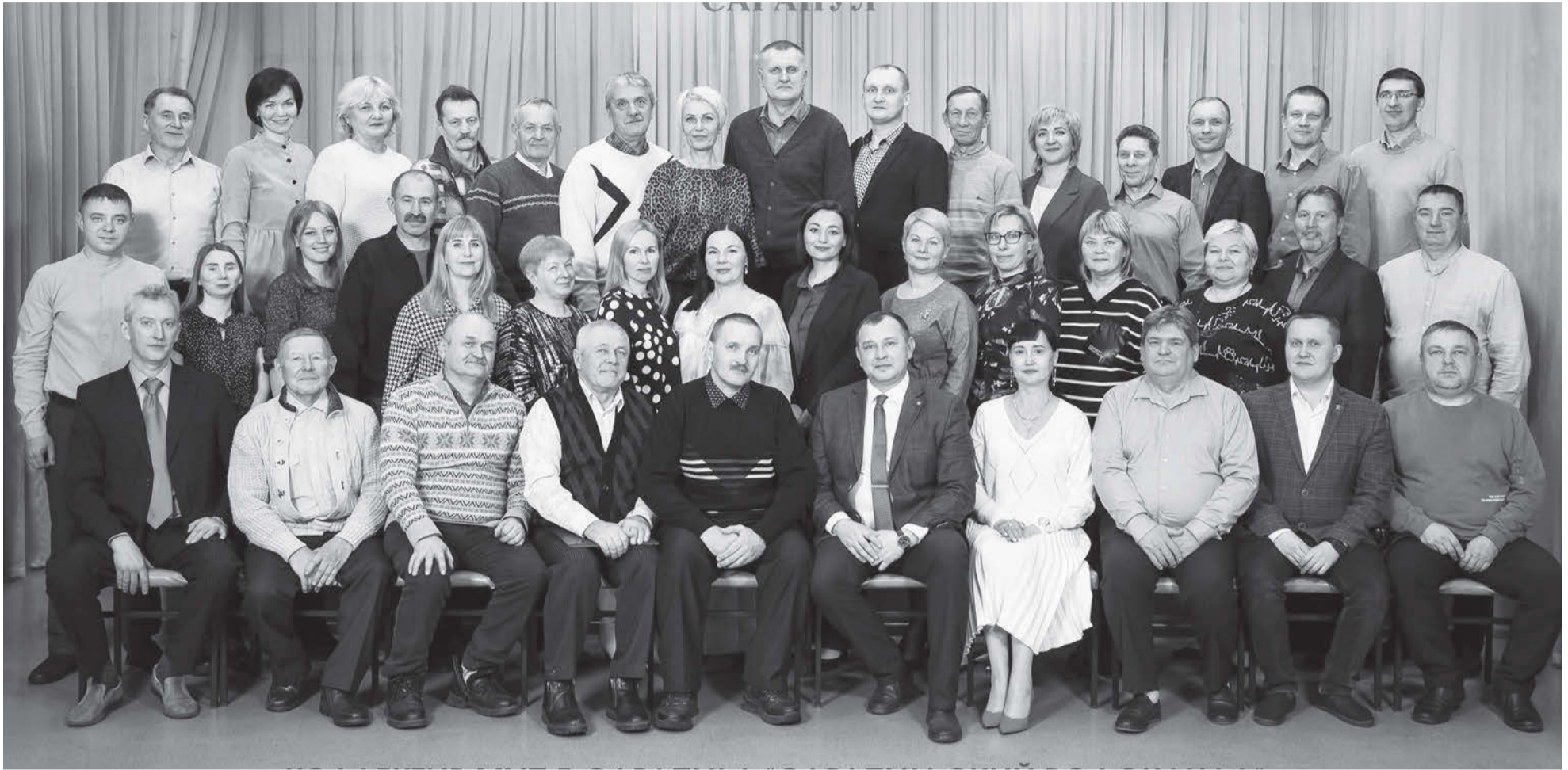
Коллектив МУП г. Сарапула «Сарапульский водоканал», декабрь 2024 года

Одному из старейших предприятий водопроводно-канализационного хозяйства России – Сарапульскому водоканалу – в этом году исполняется 155 лет