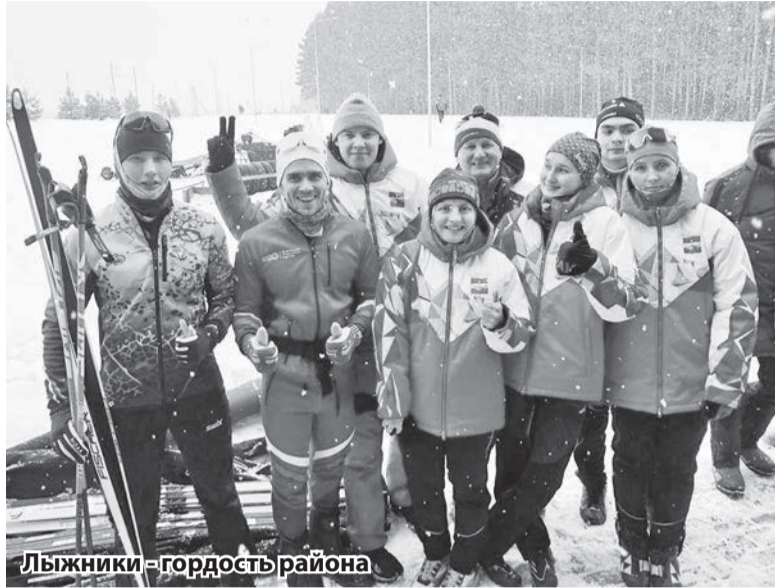
Лыжники – гордость района

Спортсмены Сарапульского района приняли активное участие в XXXI Республиканских зимних сельских спортивных играх, которые проходили в селе Селты с 26 февраля по 1 марта