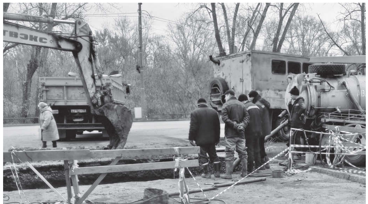
Рабочие моменты: замена части водопровода специалистами водоканала

Хочу от всей души поблагодарить всех работников нашего предприятия, кто посвятил свою жизнь работе в Сарапульском водоканале, за самоотверженный труд, высокую ответственность и профессионализм! Также выражаю глубокую признательность всем, кто сегодня работает в жилищно-коммунальной сфере и круглосуточно, не смотря ни на какие трудности, достойно выполняет свою работу. Благодаря вашей преданности своему делу жители города обеспечены комфортным и безопасным проживанием. Желаю крепкого здоровья, оптимизма, благополучия вам, вашим родным и близким!