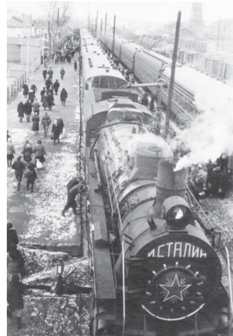
На железнодорожной станции, 1950-е годы

Коробочка поет, а я, выросший в семье политработника и политически подкованный, как тогда выражались, думаю: как иногда повороты человеческих судеб бывают нелогичны, противостественны с классической точки зрения. Победила Советская власть в Литве, национализировала землю, крупные