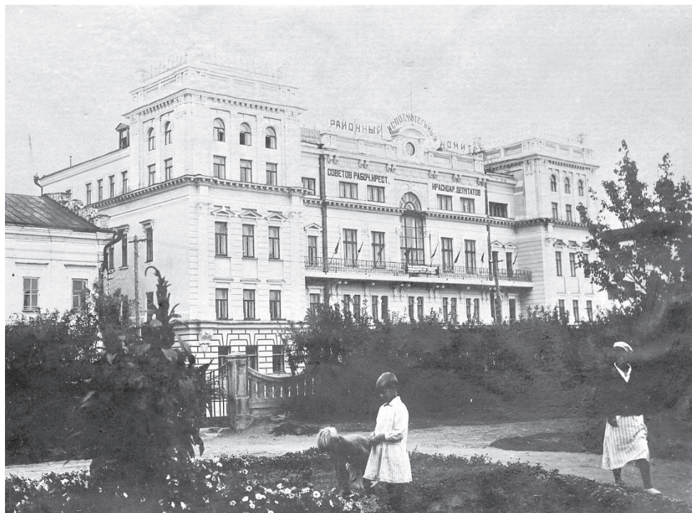
Сквер на Красной площади, 1930-е годы

М. Шитова, заведующая отделом научных исследований и экспозиций Сарапульского музея-заповедника. Продолжение следует.