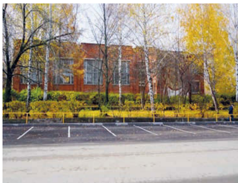
Проект «Мир без преград» Центральной городской библиотеки (благоустройство парковки)

Всего реализовано 37 проектов на 43,25 млн рублей.