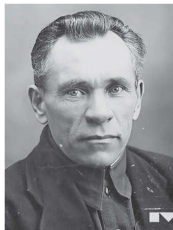
Дмитрий Петрович Бор-Раменский (1889–1965).