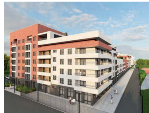
Строится многоквартирный жилой дом по улице Труда

В 2025 году введен в эксплуатацию многоквартирный жилой дом по ул. Электровозовской, 3 «г» на 60 квартир общей жилой площадью 4 тыс. кв. метров.