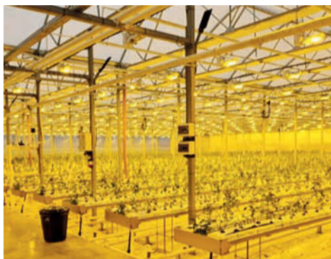
В новой теплице ООО «Цветы Удмуртии»

В ноябре ООО «Цветы Удмуртии» завершило проект по расширению площадей тепличного комплекса. В реализацию проекта вложено 90 млн рублей.