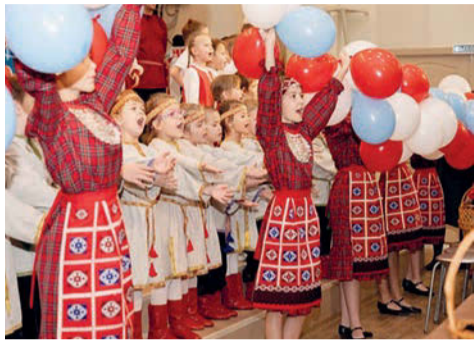
Проект «Горжусь Удмуртией моей» Детской школы искусств № 1 имени Г.А. Бобровского

11 проектов-победителей получили гранты на 28,557 млн рублей.