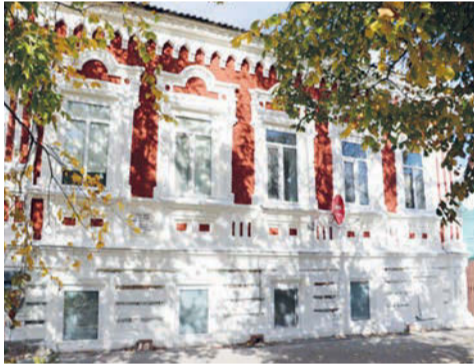
Обновленный фасад дома № 60 по улице Советской

В рамках проекта «Фасады Сарапула» благодаря Сарапульскому электрогенераторному заводу поменялся облик четырех зданий по ул. Советской, 60, ул. Фрунзе, 3 и 5, ул. Электроводострой, 11, при поддержке 72 предприятий и предпринимателей удалось заменить около 400 метров штакетника в центральной части города.