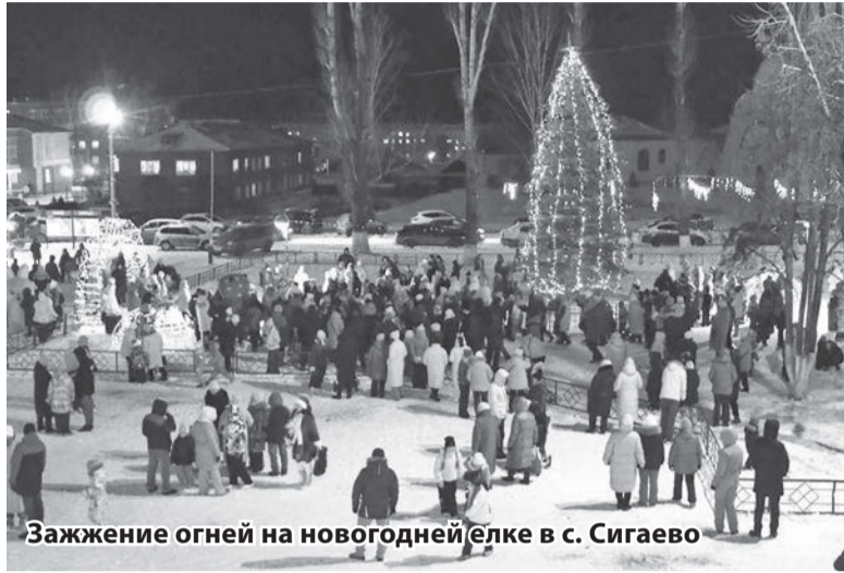
Зажжение огней на новогодней елке в с. Сигаево

В середине месяца на центральной площади села Сигаево зажгли огни на самой большой елке Сарапульского района. Это событие стало отправной точкой празднования наступающего Нового, 2026 года