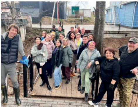
Представители малого бизнеса на экологическом субботнике по очистке берегов р. Юрманки

В городе зарегистрировано 3168 субъектов малого и среднего предпринимательства, прирост - 105,4%, самозанятых - 7458, прирост - 120,7%. Сарапул по количеству субъектов МСП занимает второе место в республике (после Ижевска). Доля занятых в секторе МСП по итогам 2025 года составила 35% общего числа занятого населения, доля уплаченных