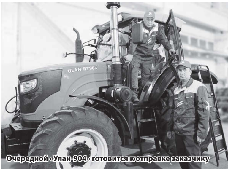
Очередной «Улан-904» готовится к отправке заказчику

«Улан-1304» приобрел весной 2024 года, взял с бороной и плугом, отдельно доукомплектовали узкими колесами, все поставили на заводе, никуда отдельно звонить и заказывать не нужно. Самые положительные стороны - это комфортная кабина, мощный атмосферный движок и хорошая КПП.