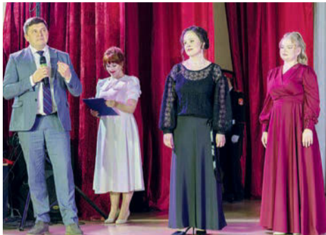
Участники конкурса «Педагог года города Сарапула»

В 11 школах города сформирован 31 предпрофессиональный класс по различным профилям. Результатом реализации целой системы профориентационной работы стали пять победителей и 12 призеров регионального чемпионата «Профессионалы» по 10 специальностям, шесть из которых - педагогические.