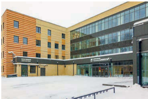
Новая поликлиника в микрорайоне железнодорожного вокзала

Благодаря нацпроекту «Продолжительная и активная жизнь» в микрорайоне железнодорожного вокзала построена новая, современная поликлиника, рассчитанная на 500 посещений в смену. Торжественное открытие состоялось 15 декабря. Общая стоимость объекта (с учетом оснащения) составила почти 1,4 млрд рублей.