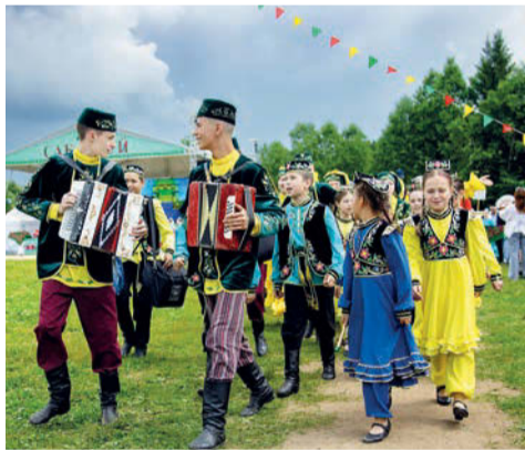
В июне в Сарапуле прошел республиканский праздник «Сабантуй»

Это проекты «Том Соьер Фест ПРО: город в городе» (ОО поддержки молодежных национально-культурных объединений г. Сарапула «Содружество»), «Туршкола безопасности» и «Адаптивный туризм» (ОО «Федерация спортивного туризма - союз туристов г. Сарапула», «Туризм детям»), «Подготовка к школе с элементами нейрокоррекции» (АНО Центр развития интеллекта «САВА»), «У Лукоморья в Сарапуле» (МБУК объединение парков «Городской сад имени А.С. Пушкина»), «Горжусь Удмуртией моей» (Детская школа искусств № 1 имени Г.А. Бобровского), «Патриотический марафон «Путь героев» (школа № 24), «Pro_СПО.18» (Центр цифрового образования детей «IT-КУБ»), «Этнография по БРАЙЛЮ» (Сарапульский музей-заповедник), «Театрально-творческие мастерские «Точка++» и «ЭКОсистема творческого образования «ТОЧКА» 2.0. Театральный профстарт» (АНО Детская театральная школа «ТОЧКА»).