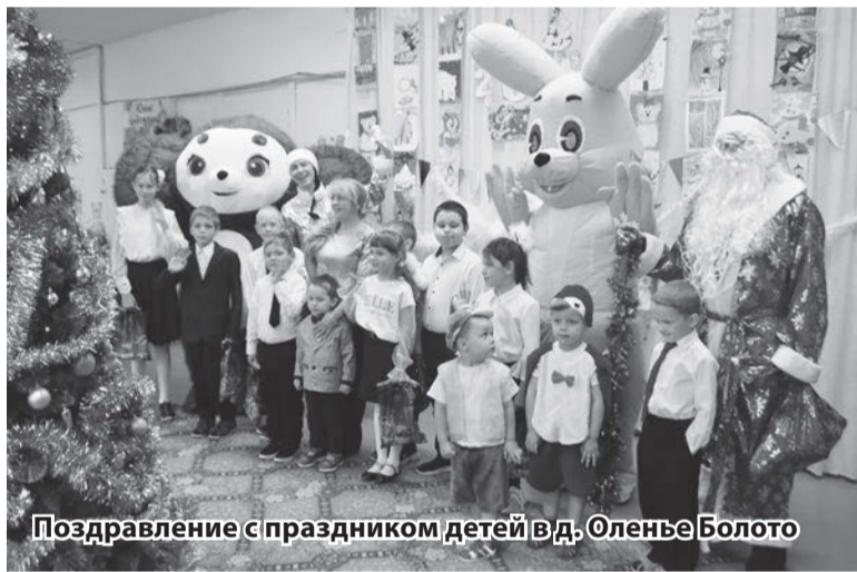
Поздравление с праздником детей в д. Оленье Болото

– больше. Впереди жителей и гостей района ждет масса веселых мероприятий в самых разных его уголках. Ежегодно работники культуры организуют в Домах культуры и сельских клу-