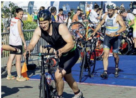
Фестиваль спорта «Гонка отважных. Возвращение героев»

В августе в Сарапуле прошел республиканский туристический слет «Большая тропа-2025» - более 300 человек со всей республики в течение трех дней соревновались в различных состязаниях.