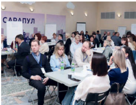
Одна из встреч по разработке Стратегии-2036

В конце ноября текущего года состоялось знаковое для Сарапула событие - утверждена Стратегия социально-экономического развития города на период до 2036 года. Наша миссия - быть привлекательным городом для всех, кто ценит уют и комфорт и хочет чувствовать уверенность в своем будущем, работая на современных высокотехнологичных предприятиях.