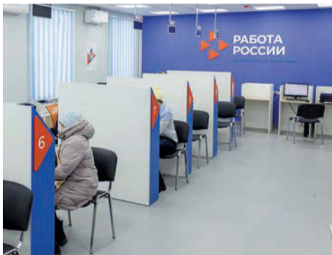
Кадровый центр «Работа России» в г. Сарапуле и Сарапульском районе

Показатели безработицы снова «бьют рекорды». Численность официально зарегистрированных безработных граждан составила 88 человек, что на 55 человек ниже значения прошлого года. Уровень зарегистрированной безработицы - 0,18%.