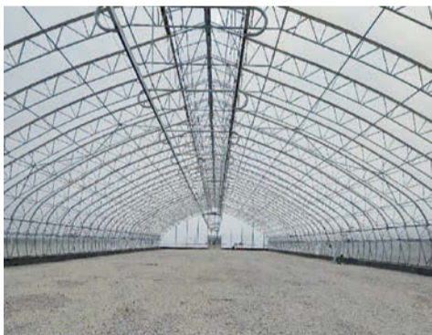
Инвестиционный проект «Создание частного питомника по выращиванию хвойных саженцев» ООО «Удан»

В настоящее время в реестр резидентов территорий опережающего развития РФ входит 24 компании г. Сарапула. Вложения в инвестиционные проекты в 2025 году составили 436 млн рублей (всего же с 2018 года - 9,2 млрд рублей). За уходящий год создано 760 новых рабочих мест (3353 рабочих места - с начала действия режима ТОР).