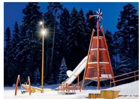
Преображенный парк «Молодежный»

ния 2024 года по благоустройству в рамках реализации федерального проекта «Формирование комфортной городской среды» национального проекта «Инфраструктура для жизни», успешно завершил свой первый этап преобразования (32,4 млн рублей).