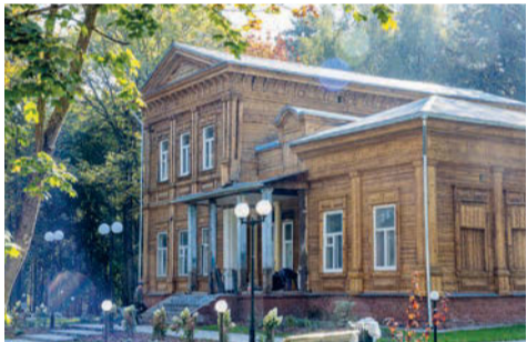
Дача Барабанщикова превращается в Музей дачного быта

В результате участия Сарапульского драматического театра в федеральном проекте «Культура малой родины» партии «Единая Россия» осуществлена постановка спектаклей «Горе от ума» и «Дон Кихот», а также проведены мероприятия по модернизации материально-технической базы.