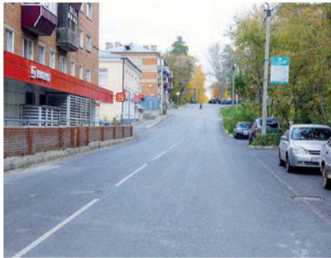
Обновленная улица 1-я Дачная

В рамках нацпроекта «Инфраструктура для жизни» был проведен ремонт ул. Пугачева от ул. Азина до ул. Лесной и ул. 1-й Дачной от ул. Пугачева до стадиона «Энергия». Общая стоимость работ составила 115,4 млн рублей.