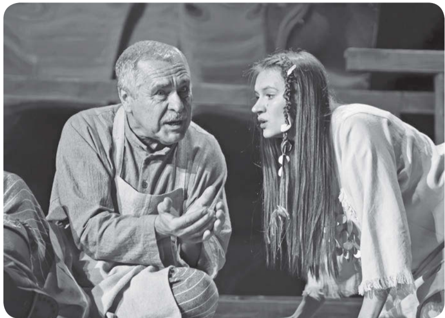
Фрагмент спектакля по произведению А.С. Пушкина «Русалка» на удмуртском языке